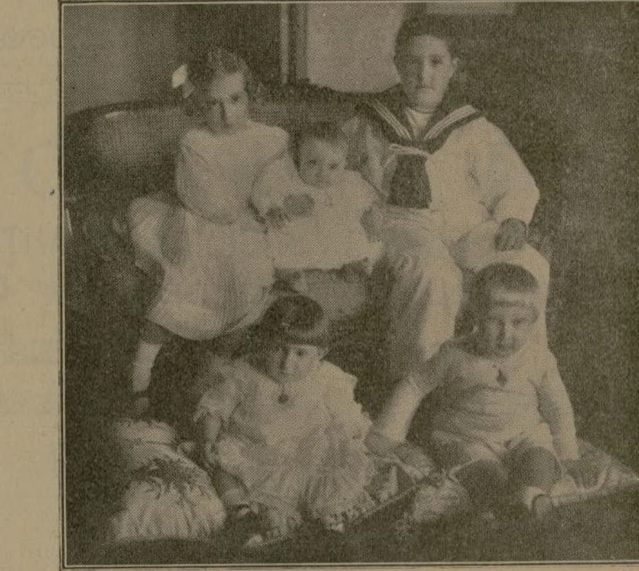
En primer término: La Princesa D.ª Dolores y el Príncipe D. Carlos. En segundo término: La Infanta D.ª Isabel, la Princesa D.ª Mercedes y el Infante D. Alfonso.

De nuestra conversación con Sus Altezas poco temas de decir ya; hablamos de todo lo de actualidad en aquel día de la heroica catástrofe del aeródromo de París, la mentando el Infante o sucedió por culpa, no de los organizadores, sino de las