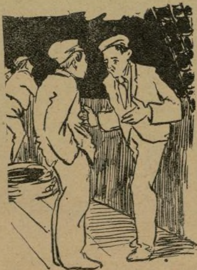
El aludido, se apresuró á rectificar:

traré que no me infunde pánico ningún italiano.