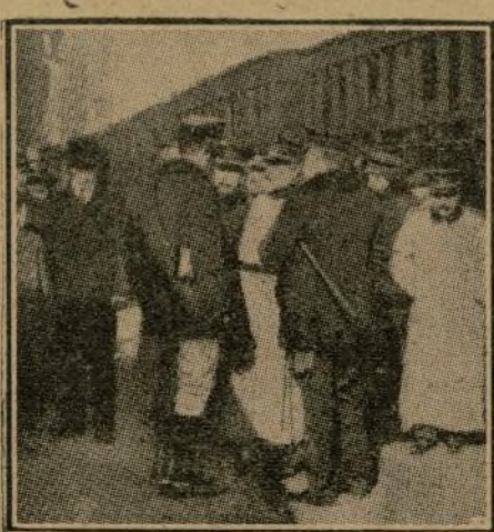
El capitán general de Madrid despidiéndose del coronel D. Manuel Prieto.