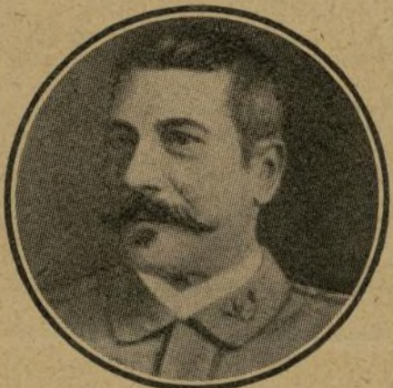
Que resultó herido gravemente en el combate del día 27.

entrarán los pueblos salvajes en el concierto universal enviándoles apóstoles de paz? Contesten categóricamente los que así piensan, inspirándose en una fuente bastante cercana: en lo que ocurre en el Imperio mogrebíta.