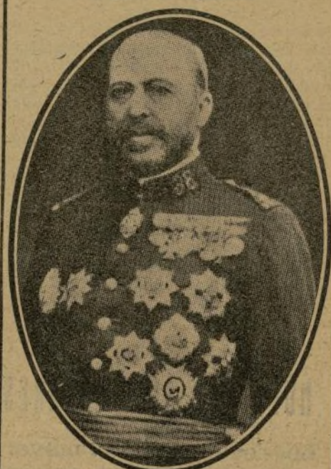
Este bravo militar que con tanta energía se condujo en los últimos combates merece los aplausos que tributámosle con entusiasmo.

aparecen, son débiles y confusas, se ignora lo que pueden llegar á ser y necesitan pasar por un período de resistencia para que se conozcan clara y distintamente; de ese modo se propagan, se purgan de defectos, se mejoran y triunfan ó sucumben si no tienen condiciones de vida.