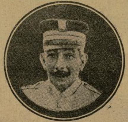
Muerto al pelear con denuedo al frente de su batallón de Ceriñola.

los campos africanos; toda su juventud, aromada por ideales y esperanzas, cayó,