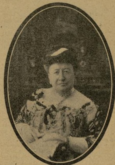
La Marquesa de Nájera

Hace poco cayó enferma la marquesa, sin que su enfermedad inspirase serios temores; pero, así y todo, la Infanta Isabel no se ha separado un momento de su lado, hasta que esta mañana, sin que se presintiera tan rápido desenlace, falleció la noble señora, rodeada de sus hijos y sus más próximos parientes.