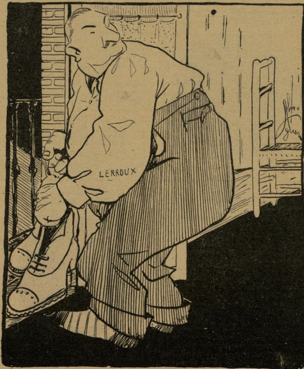
DI Alejandro.—¡Si viniese entre los magos D. Toribio el de las Pampas...