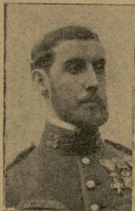
Uno de los más heroicos oficiales que resultaron heridos en el combate del día 27.

gunos ejemplos, pocos, en que la guerra ha representado, no el triunfo de una cultura más elevada, sino de una energía mayor; pero habrá sido, no una energía brutal y caprichosa, vacía por completo de contenido racional y legal, sino propulsora de nueva vida, de ideas jóvenes, de progreso.