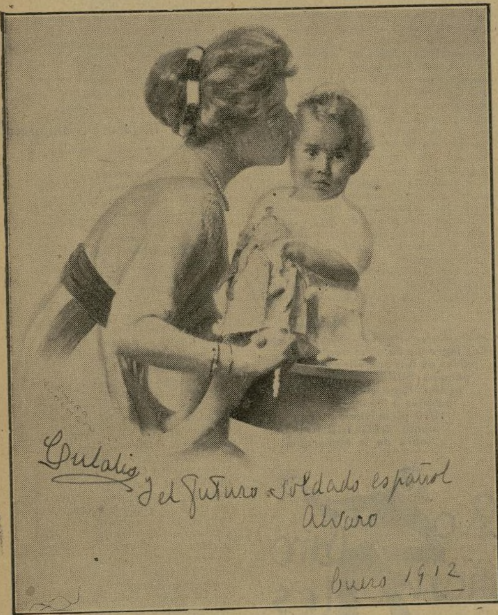
Eulalia y el futuro soldado español Alvaro

S. A. R. la Infanta Doña Eulalia, dice á los españoles por conducto de "La Monarquía"