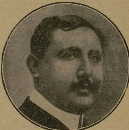
Nuestro ilustre colaborador el Excmo. Sr. D. Gabriel Maura y Gamazo, mantenedor de los Juegos florales en Sevilla.

Uno y otro discursos han sido calurosos y unánimemente elogiados. Tanto al referirse en los Juegos Florales al feminismo, del cual se mostró partidario, como al evocar el espíritu artístico de Sevilla en el siglo XVII, cuanto, al ocuparse en el Ateneo de la honda crisis que atraviesa en España la política social y la labor educadora que debe emplearse para remediarla, cautivó con su brillante oratoria á su auditorio, obteniendo en ambos locales verdaderas ovaciones.