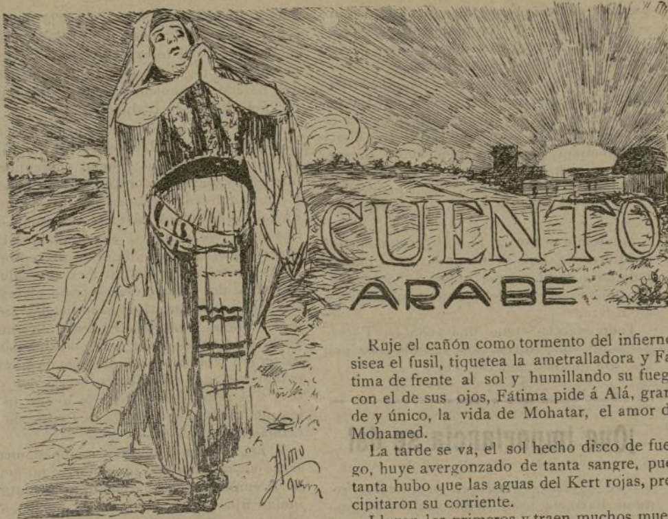
A. J. C. Por pensar en ti, te dedico este cuento.

En la revista tomaron parte 60.000 soldados.