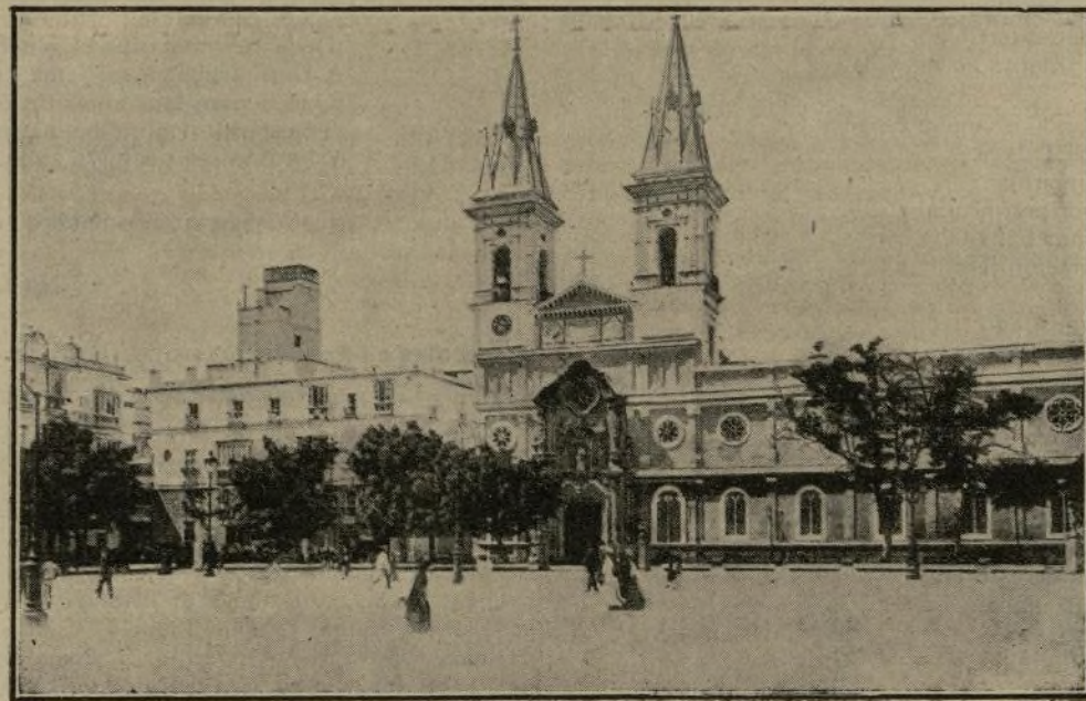
Plaza de la Constitución de Cádiz.

Dos y media de la tarde: Garden party en el Parque Genovés, en honor de todos los presidentes de las Diputaciones, con asistencia de todas las representaciones na-