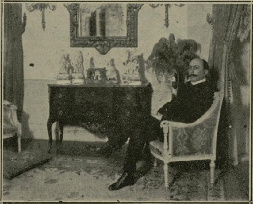
El Excmo. Sr. Marqués de Lema.

Vadillo, fui subsecretario de este Ministerio, y lo dejé para casarme aunque al mes de dejarlo cayeron los conservadores. En el Gobierno Maura me nombraron alcalde de Madrid, cargo que ocupé desde el mes de Julio de 1903 al mes de Diciembre de 1904.