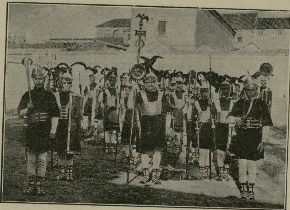
Grupo de Centuriones.

En ese día de exaltación y regocijo, muer ren, oh dolor, estas dos figuras de un puro andalucismo; pero, como diría el tierno Horacio: estos dos buenos amigos no «mue ren del todo». Al igual de los forúnculos, brotarán todos los años al iniciarse las bris as primaverales.