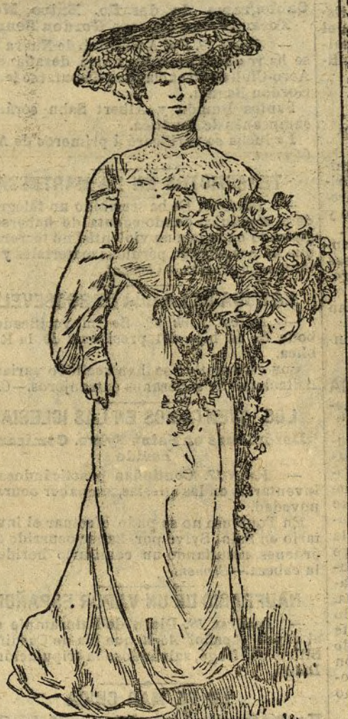
Miss Alice Roosevelt

En cuanto a su valor, el New York American calcula excede el de los presentes recibidos.