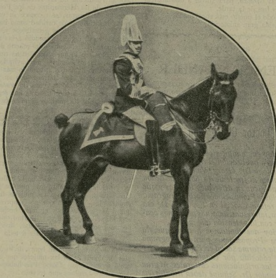
S. M. el Rey D. Alfonso XIII con uniforme de gala de la Escolta Real y montando el caballo «Capricho», que le fué regalado por el Presidente de la República Francesa, en su reciente viaje á Paris.

La Italia, la Alemania han dado pruebas, ante todo, de amor ardiente y sagrado por la Patria, trabajo sin tregua, infatigable, con todos sacrificios y soportando penas, por sus deseos y aspiraciones de progreso y civilización, su mayor entusiasmo y miras más elevadas.