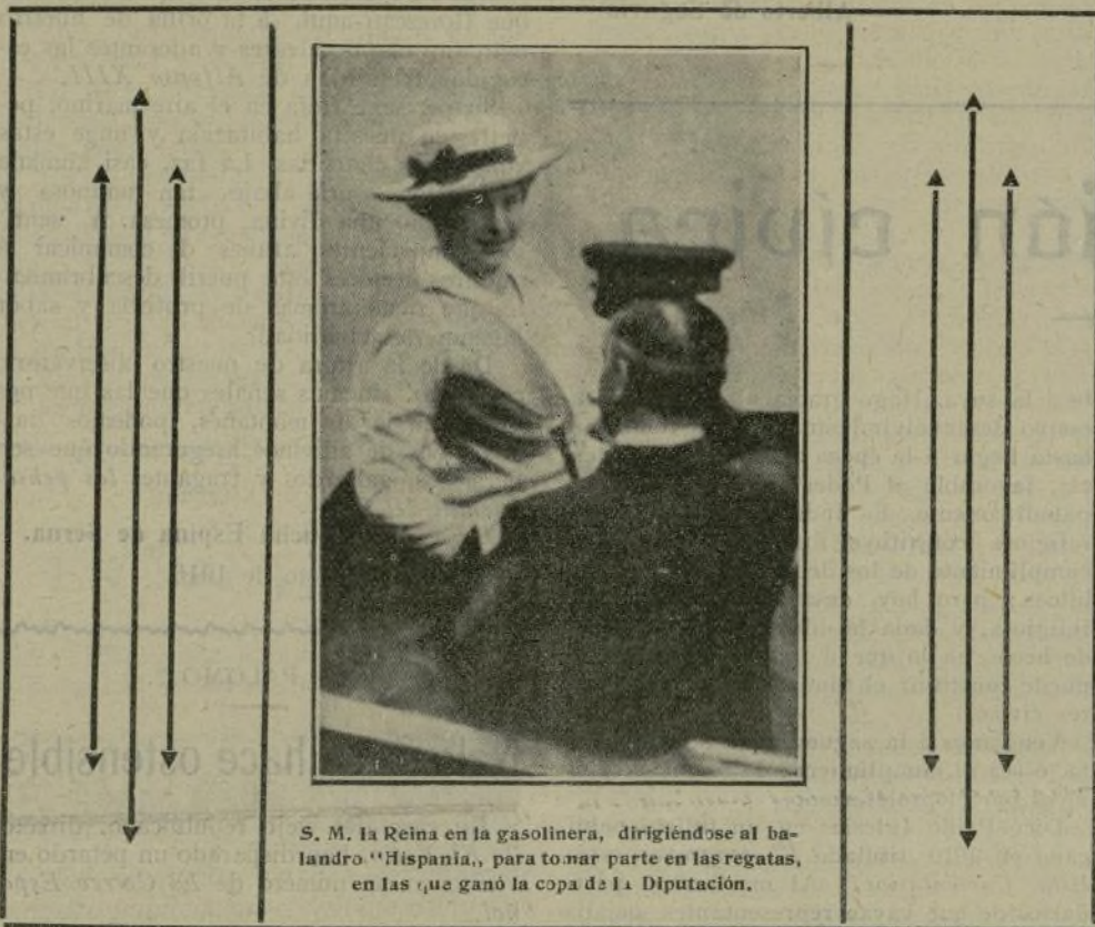
S. M. la Reina en la gasolinera, dirigiéndose al baidro "Hispania", para tomar parte en las regatas, en las que ganó la copa de la Diputación.

De la segunda á la tercer boya tuvieron los baidros el viento á un largo, dando las olas por babor.