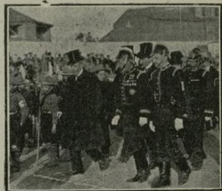
El Ministro de la Gobernación revistando á los bomberos después de repartir condecoraciones.

queñas), modernas, higiénicas y capaces, y esto lo antes posible, tanto en las ciudades como en la campiña, y no sólo para los obreros, sino también para los habitantes pobres. Todos estos últimos proyectos creo podrían realizarse con poca dificultad cuando la ciudad y demás Municipios establecieran habitaciones tales, bajo su propia administración y las eximieran de impuestos y contribuciones por un período (veinticinco ó treinta años), y cargándolas, aun después de este período, con impuestos leves. De tal manera podría también interesarse al público en esta acción. Para poder propagar mejor y más prontamente la institución, formar delegaciones nacionales y municipales que constantemente mantengan vivas estas cuestiones, tratando de propagarlas y resolverlas.