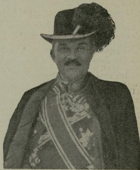
El ilustre diplomático Príncipe de Furstemberg que ha presentado á S. M. sus cartas credenciales.