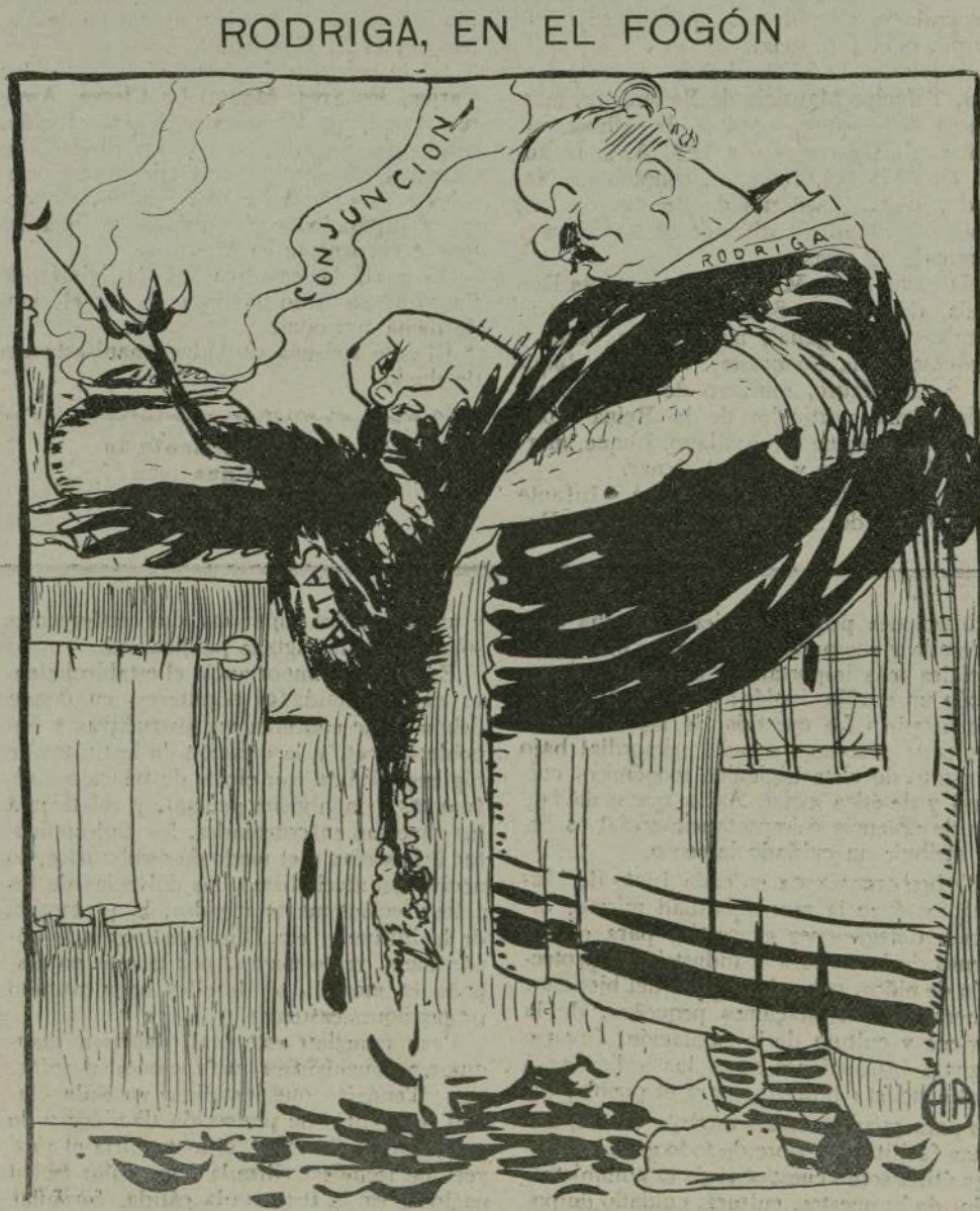
¡Qué duro de pelar está el pavo éste!

Lejos ya del espíritu madrileño, los viejos y ridículos tópicos anticatalanistas, interesan grandemente aquí las cosas de Cataluña, hasta el punto de haberse interesado por el proyecto de Mancomunidades elementos que, al parecer, tenían que permanecer neutrales en el debate.