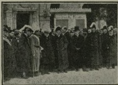
El Gobierno en la presidencia del entierro de Pidal.