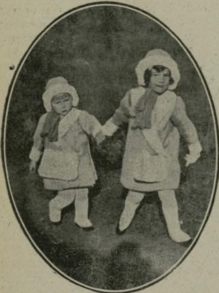
Fotografía de SS. AA. las Infantitas doña Beatriz y doña María Cristina obtenida por su augusto hermano el Príncipe de Asturias, en la Casa de Campo.

sentido patriótico y con criterio político absolutamente impersonal.