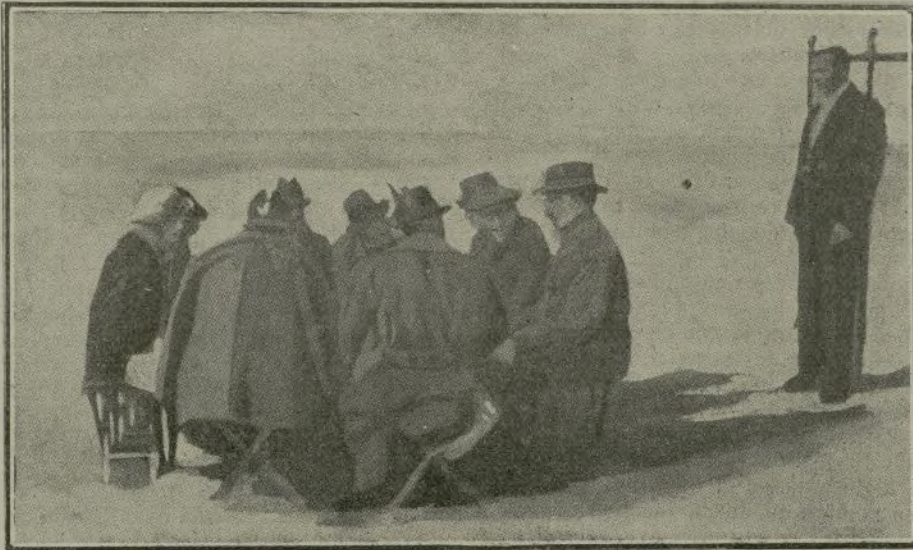
S. M. almorzando en el campo con los aristocráticos cazadores.

siempre, acertada y justa al otorgar esta regia merced al señor marqués de Comillas.