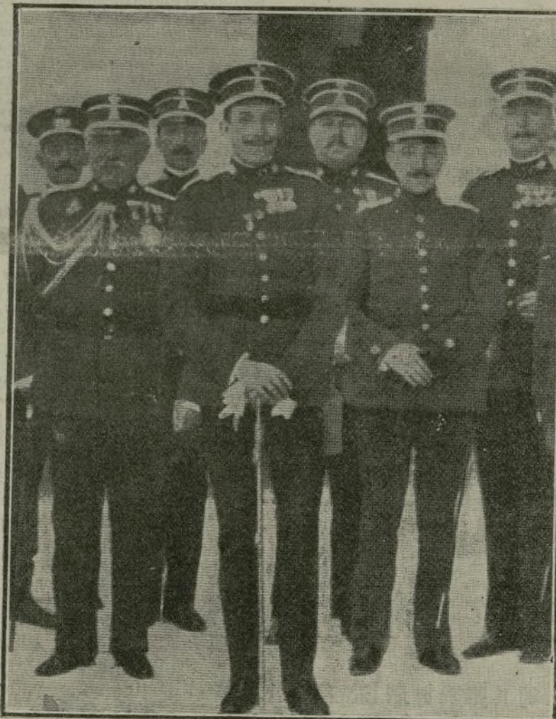
El Soberano acompañado por el Comandante general de Alabarderos y los gefes de la Escolta Real.