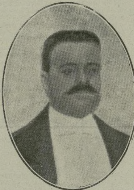
El insigne y patriota periodista parisino Mr. Gaston Calmette, víctima del farsante ex ministro de Hacienda francés, J. Caillaux.

juiciar en semejante asunto, aunque la solidaridad profesional nos da derecho á protestar en nombre de la civilización, y confiamos en que el alto espíritu de justicia del culto pueblo vecino sabrá una vez más cumplir con su conciencia y con sus leyes.