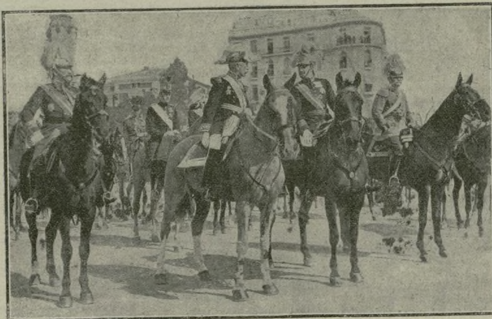
Su Majestad el Rey, presenciando la jura en compañía de los generales Lyantey, conde del Serrallo y ministro de Alemania Príncipe Max de Ratibor.]