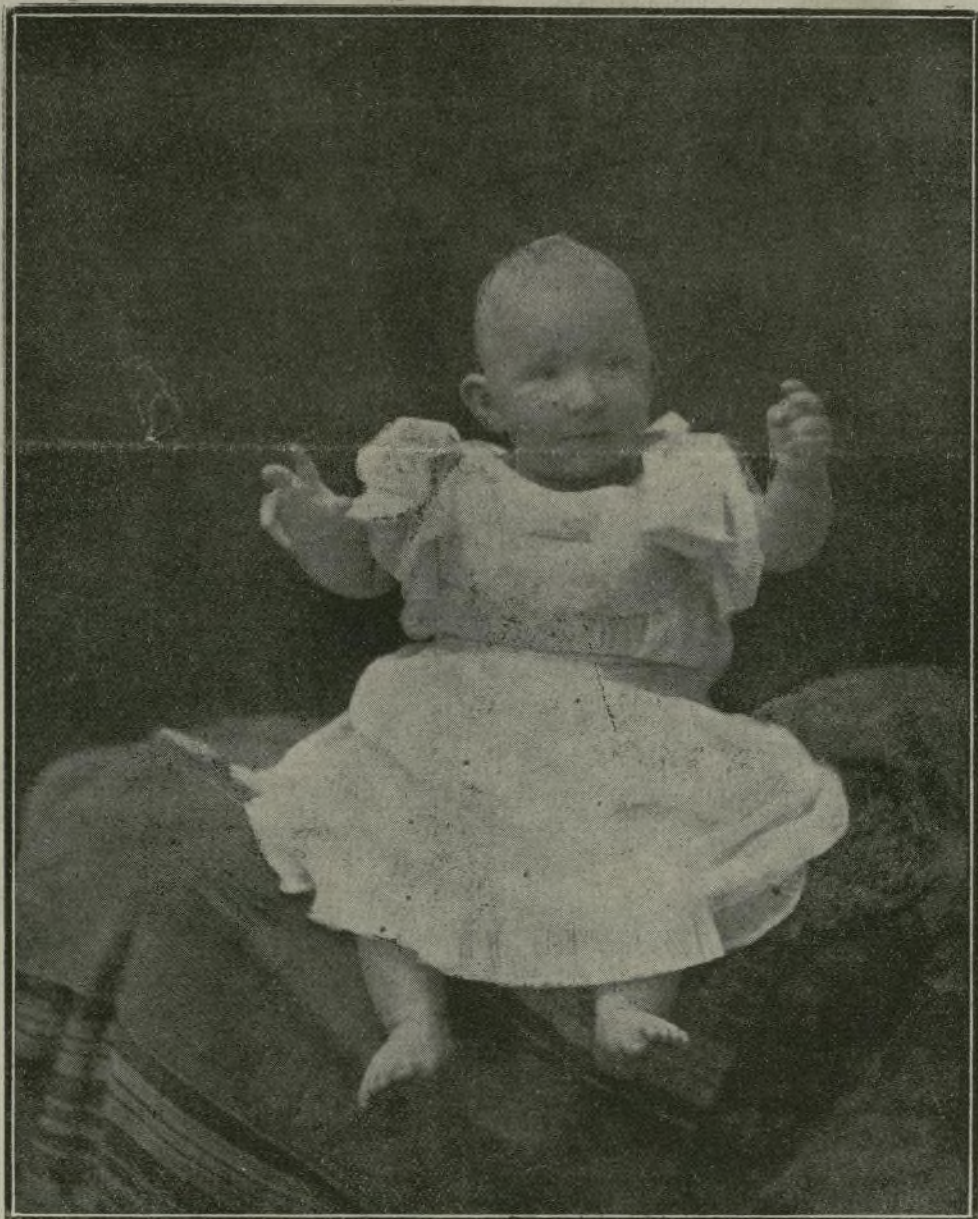
El menor de los augustos hijos de nuestros Soberanos.

laquelle la votation de la majorité aurait gagné les candidats pour sa cause, qu'elle est maintenant obligée de perdre.