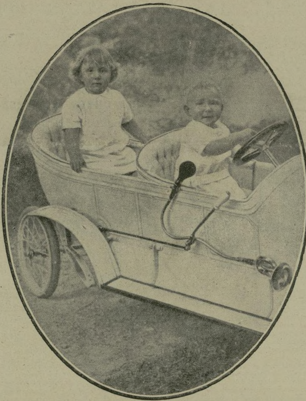
Sus Altezas los Infantitos D. Juan y D a . Cristina, jugando en los jardines del Pardo con el automóvil que les regaló M. Poincaré.

action réglementaire moyennant l'intervention de l'Institut de Réformes Sociales.