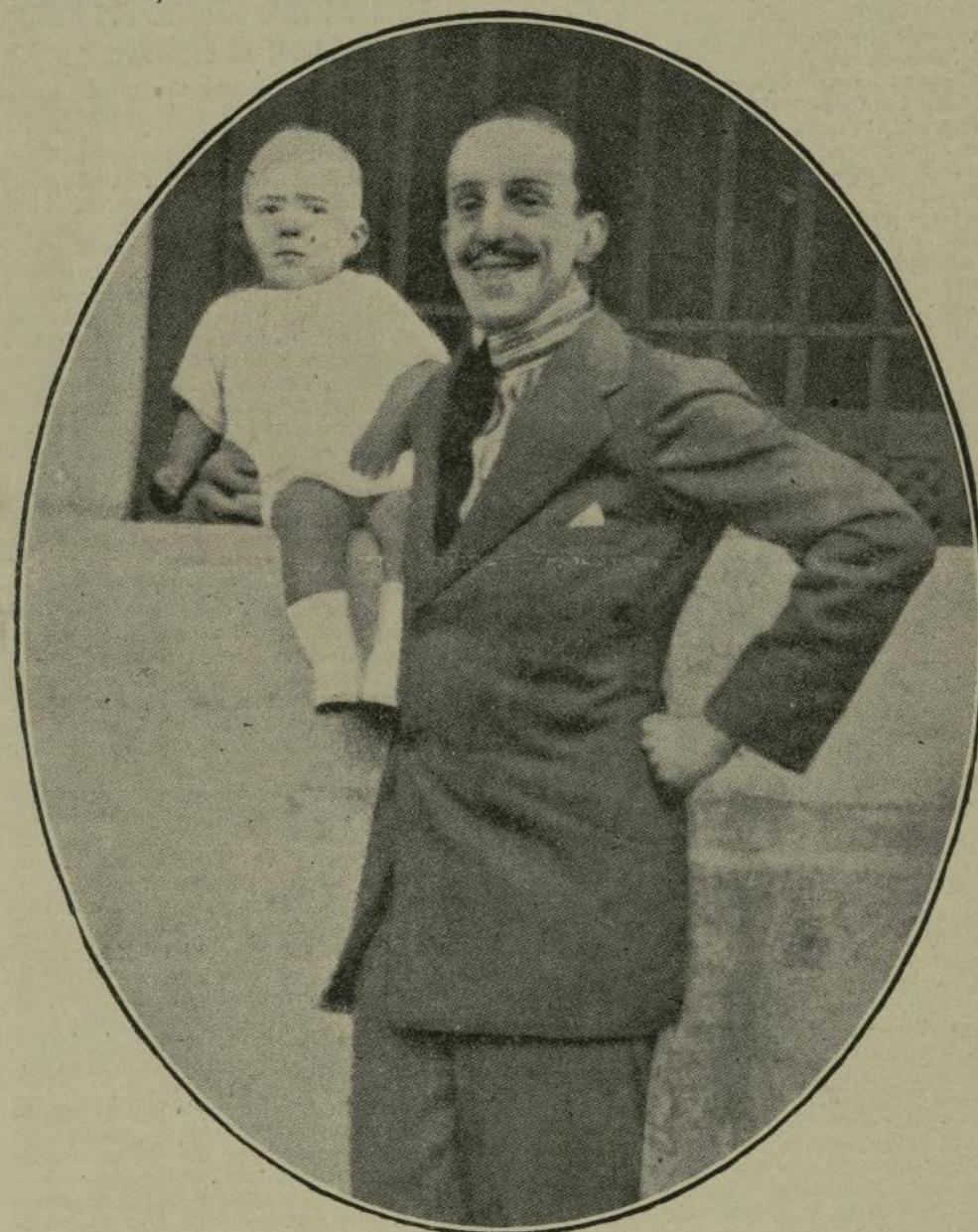
Su Majestad el Rey, con su augusta hijo el Infante D. Juan. Esta fotografía fué hecha en la Academia de Artillería el 20 del actual, día en que cumplió el Infantito su primer aniversario.

Sr. Dato quedará proclamado jefe del partido conservador.