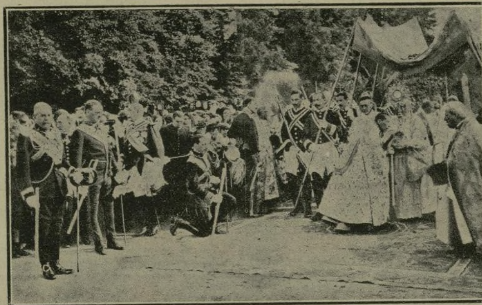
La procesión de la infraoctava del Corpus en la Granja. El Soberano, de rodillas al pasar la Custodia.

para instalar 500 exploradores de Madrid y provincias.