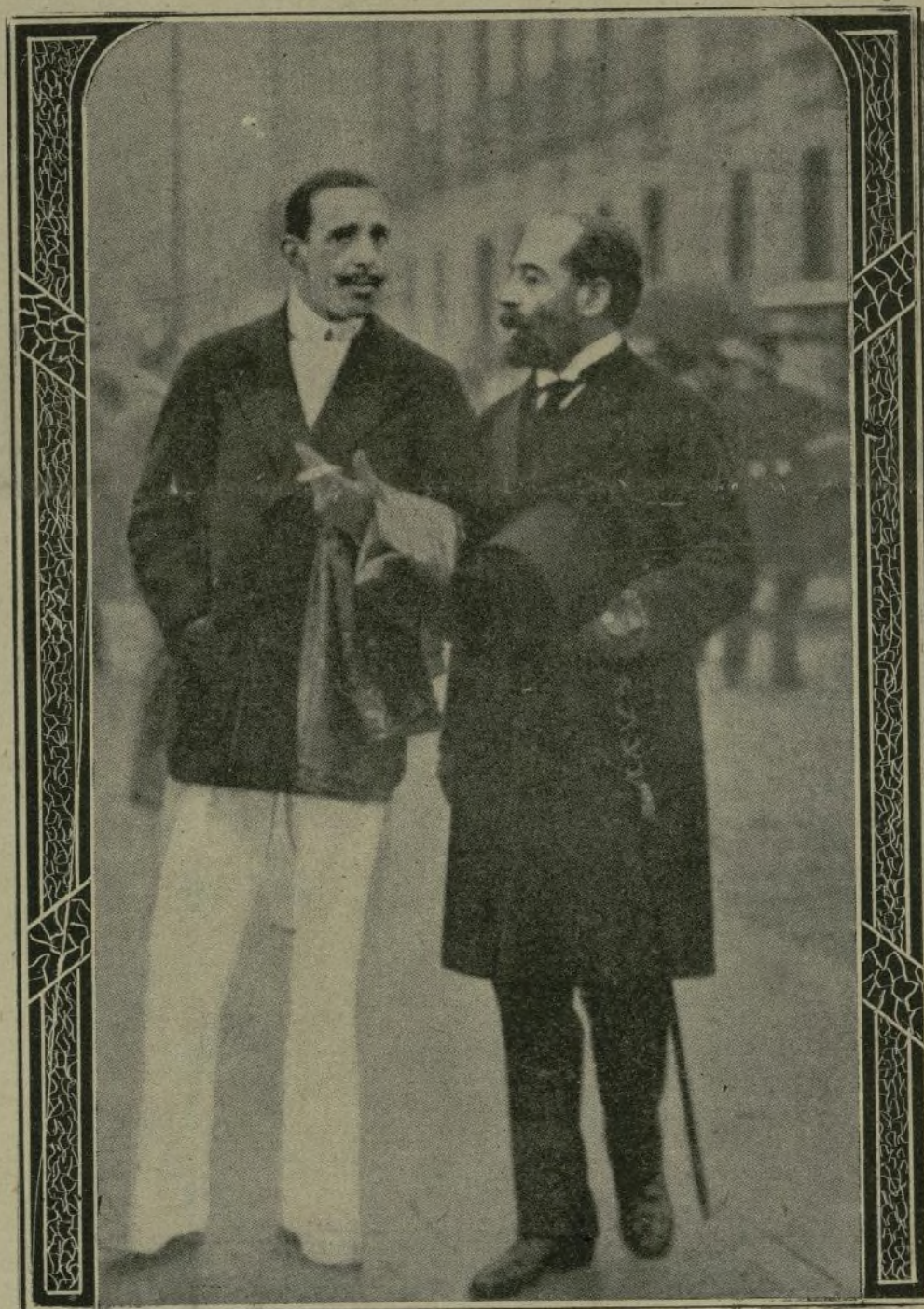
S. M. Don Alfonso XIII, conversando con el marqués de Atarfe, gobernador civil de Guipúzcoa, al ir a tomar parte en las regatas del Club Náutico.

more excited on account of the circumstances we already related in due time, have placed all kinds of obstacles in the way of this Government which,—had it not been so firmly consolidated by the opinion of the country, would have met with great difficulties in developing not only the beginning of its announced program, but also in resisting the rough attacks of so many wild beasts which gave vent this time to the smallest political passions.