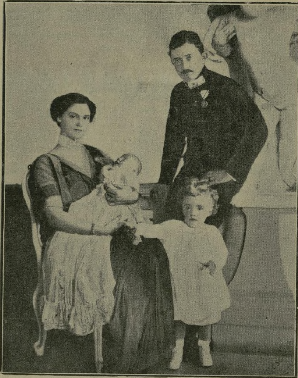
El Archiduque Carlos Francisco José, heredero del trono de Austria-Hungria; su esposa la Princesa Zita de Borbón-Parma, y sus hijos el Archiduque Francisco Otón y la Archiduquesa Adelaida.

la subida del precio. Y como esto precisamente no les ha de resultar, por lo menos en las fábricas de la Sindicación, tratan de anunciarse sembrando alarmas en el público, que en definitiva se liquidan, sirviéndoles á ellos de justificación ante su clientela, para explicarles el por qué han subido los precios.»