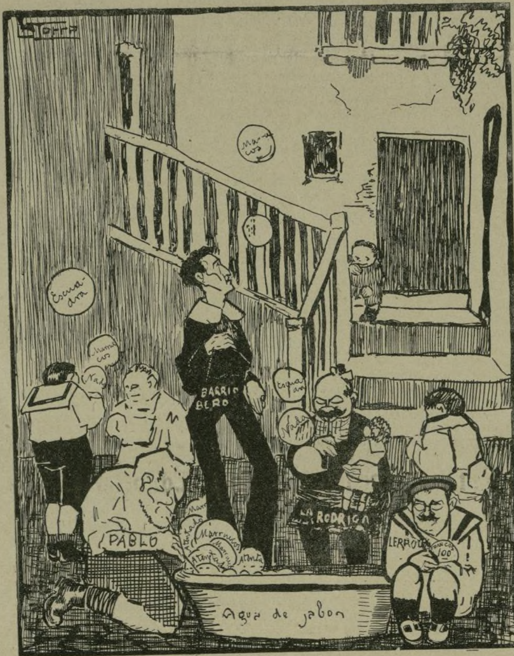
Los terribles chicos conjuncionistas, solazándose con su anunciado programa de festejos veraniegos.

Después asistió á una recepción en la Diputación.