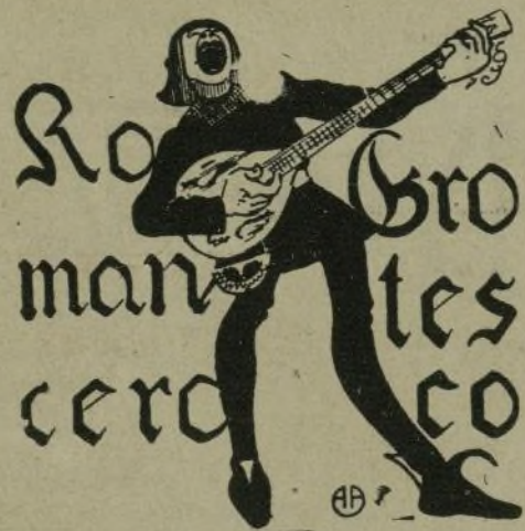
El grito del día.

Desde hace ya un mes ó dos no se cansa uno de oír unas veces «Maura, no» y otras veces «Maura, sí».