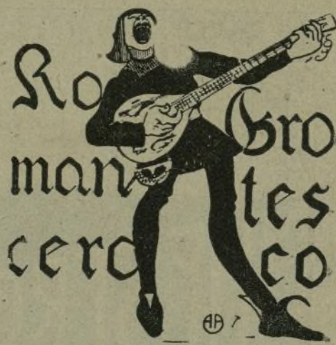
La fiesta nacional.

En un mítin lerrrouxista, Giner de los Ríos ha dicho que no confía en que la generación actual haga la revolución. ¡Vamos, hombre! Ya es hora de que vayais di- ciendo la verdad al pue- blo. La generación actual tiene muy buen senti- do de la razón y del patriotismo. ¡Por eso, señor mío, por eso! : : :