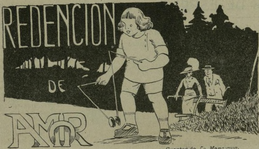
Cuentos de La Monarquía.

Amalia, mujer de unos veinticuatro años, rubia, esbelta, ojos verdes, grandes y rasgados. Ama con vehemencia, con pasión arrebatadora, sensual, y es entusiasta del lujo en el vestir y de las joyas.