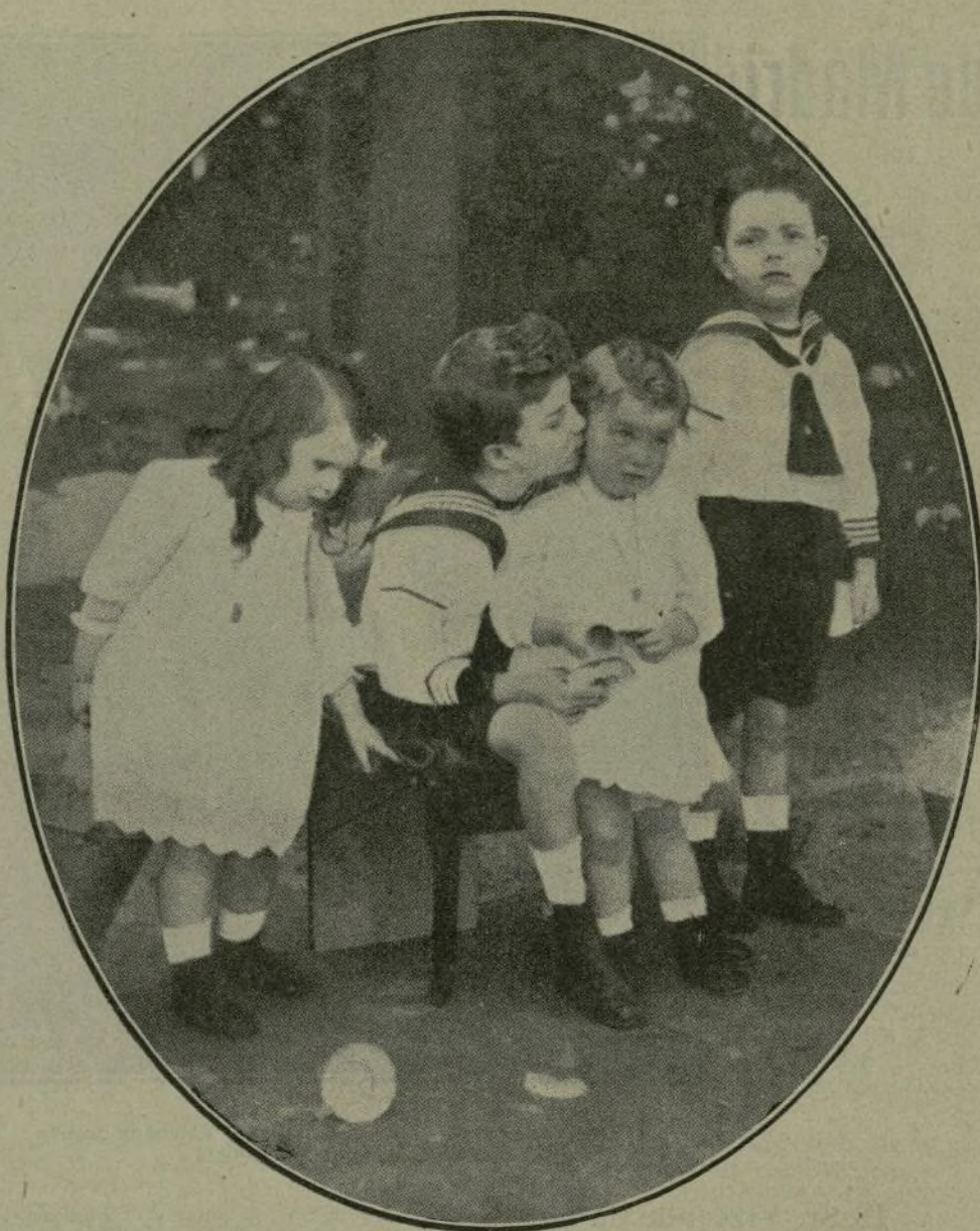
Fotografía reciente de los augustos hijitos del Infante D. Fernando y de aquella santa que en la tierra se llamó Doña Maria Teresa de Borbón, cuyo recuerdo vivirá en nuestro corazón siempre.

¡Con cuánta pena hemos de notificar este tristísimo suceso! Era el ilustre finado uno de los más cariñosos amigos de nuestro Director y uno de nuestros colaboradores más asiduos, más inteligentes y más cultos.