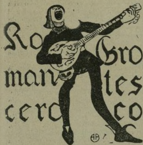
DE FUERA DE CASA

Todo son males, señores, todo se vuelven desgracias... La Prensa todos los días hecha viene un mar de lágrimas. Por todas partes hay crímenes, robos, revueltas, batallas, situaciones pel'grosas, política tumultuaria... Pero, afortunadamente, todo ello es fuera de casa.