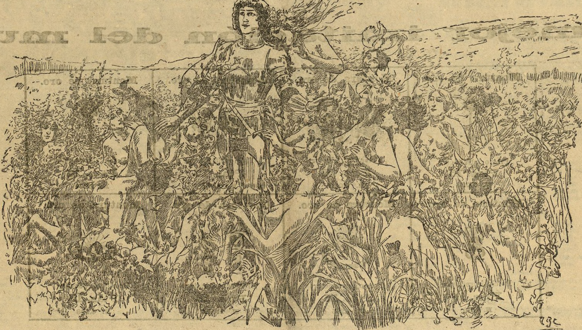
PARSIFAL.—Cuadro de C. Rochegrosse

mentario en España está deprimido en el concepto público; por eso han ocurrido muchas cosas que no debieron ocurrir; hay, ó que suprimirlo, ó que dignificarlo. Y esto último es el deber de todos los que se llamen amantes del régimen parlamentario y no quieran por vías indirectas darles la razón a los enemigos de aquél. Pues para dignificarlo, lo primero es respetar escrupulosamente el espíritu de aquél.