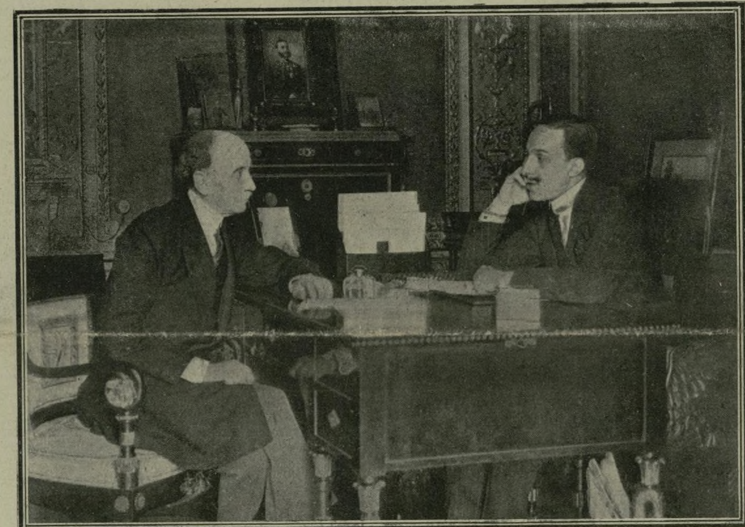
El Rey, despachando con el ilustre jefe del Gobierno, D. Eduardo Dato, que con tanto patriotismo está procediendo en los actuales criticos momentos.

«Mantendremos la neutralidad en la misma forma en que, por no tener tampoco pactos con nadie, mantuvieron las demás naciones en nuestra guerra con los Estados Unidos, en aquellos difícilísimos