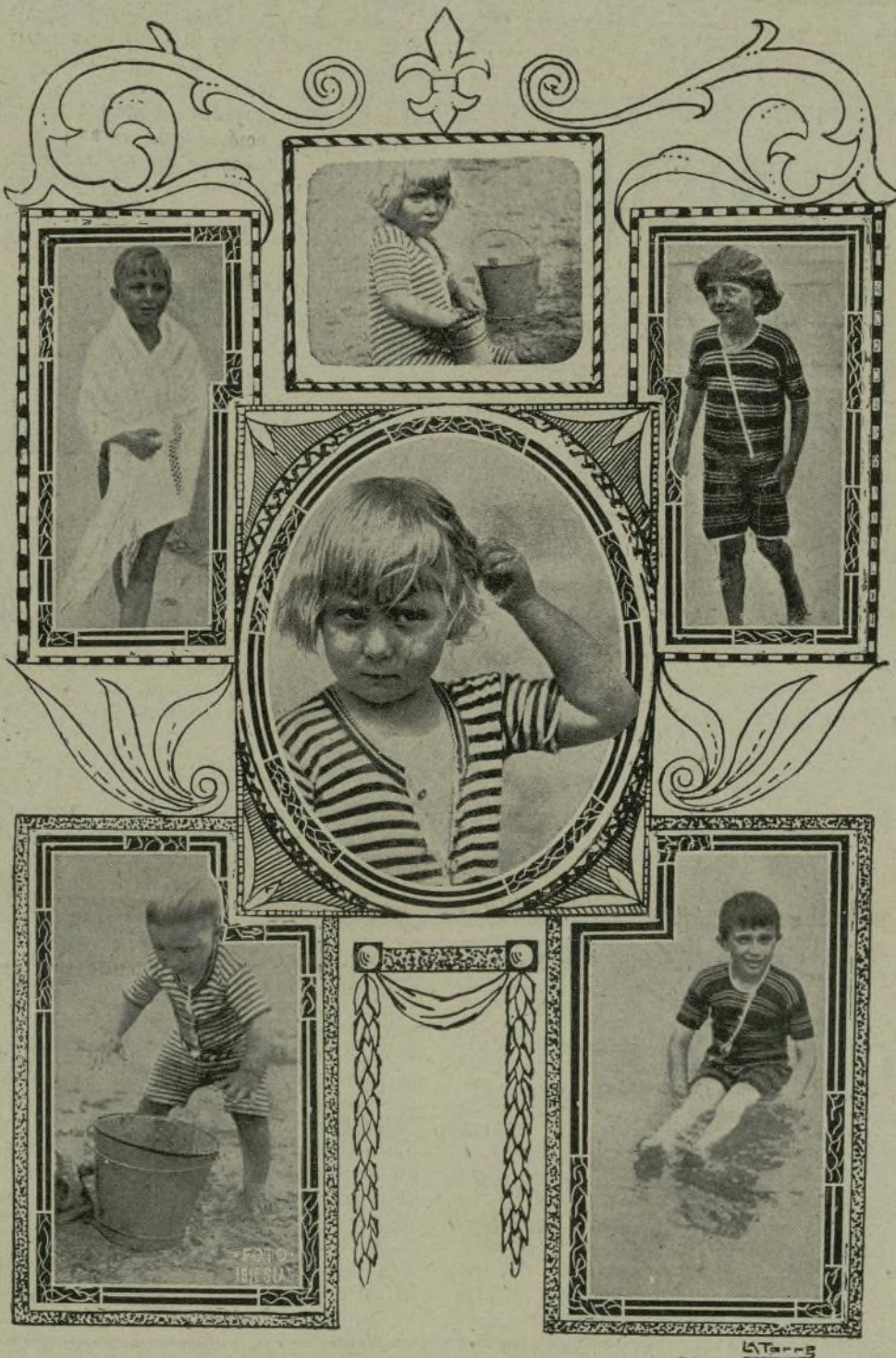
Ultimas fotografías de los augustos hijos de los Reyes de España, hechas en la playa de San Sebastián.

«El Ejército francés, que operaba en la misma región, acudió en su ayuda, figu-