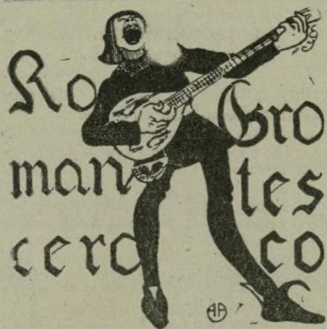
UNO QUE DESAFINA