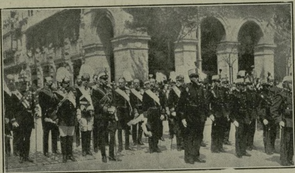
El Rey con su estado mayor, presenciando el desfile militar, después de celebrados en la iglesia del Buen Pastor, en San Sebastián, los funerales por el alma de S. S. Pio X.

La ciudad francesa de Cambray ha caído en poder de los alemanes.