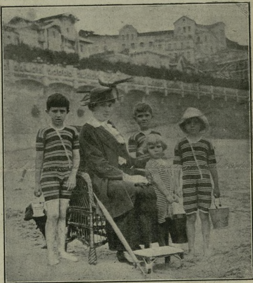
Interesante grupo de S. M. la Reina Doña Victoria con sus augustos hijos, obtenido últimamente en la playa de San Sebastián.