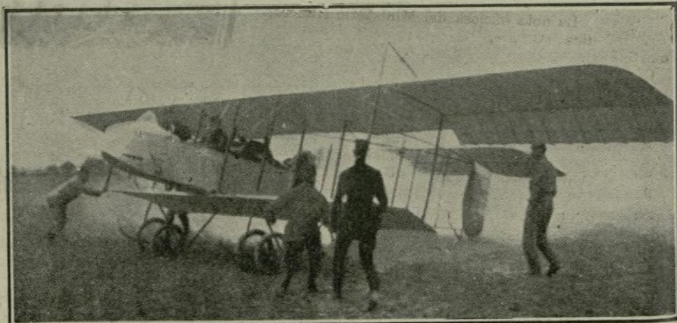
Aeroplano de la flota militar francesa, en el momento de emprender la salida para prestar servicio de vigilancia sobre París.