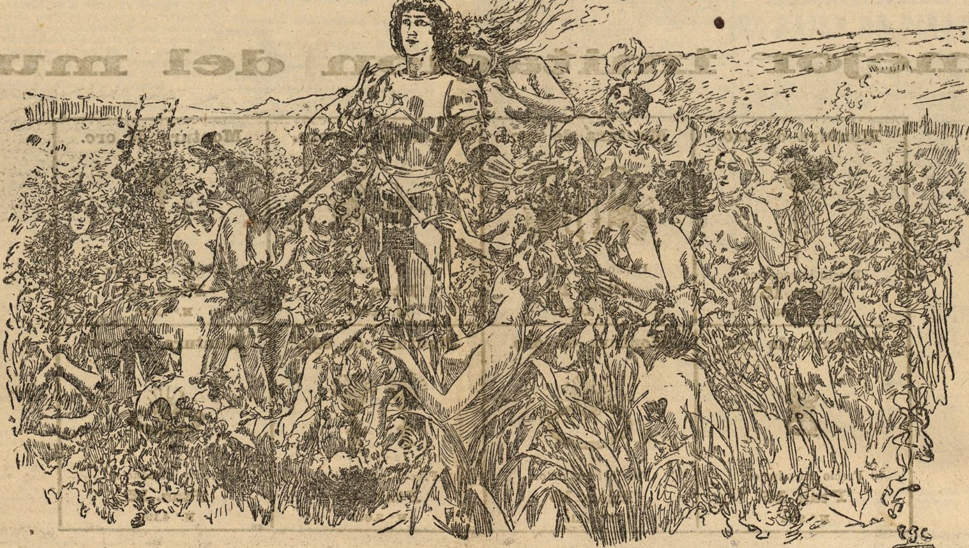
PARSIFAL.—Cuadro de C. Rochegrosse