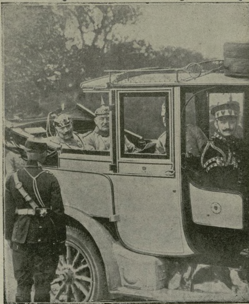
Guillermo II acompañado del generalísimo Moltke, interrogando a un oficial sobre las incidencias de un combate.