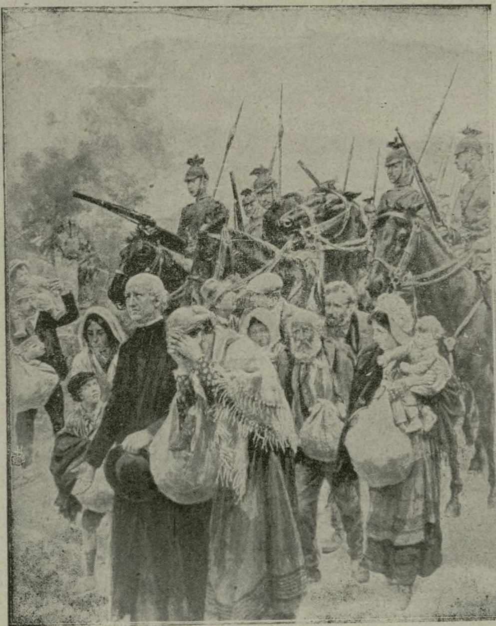
El pueblo belga huyendo ante la invasión germana.

progresar apenas de 500 á 1.000 metros por día.»