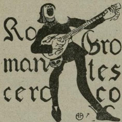
PLATO DEL DIA

¡ Viva la estafa, señores! En estos tiempos menguados son muchos los estafados y más los estafadores.