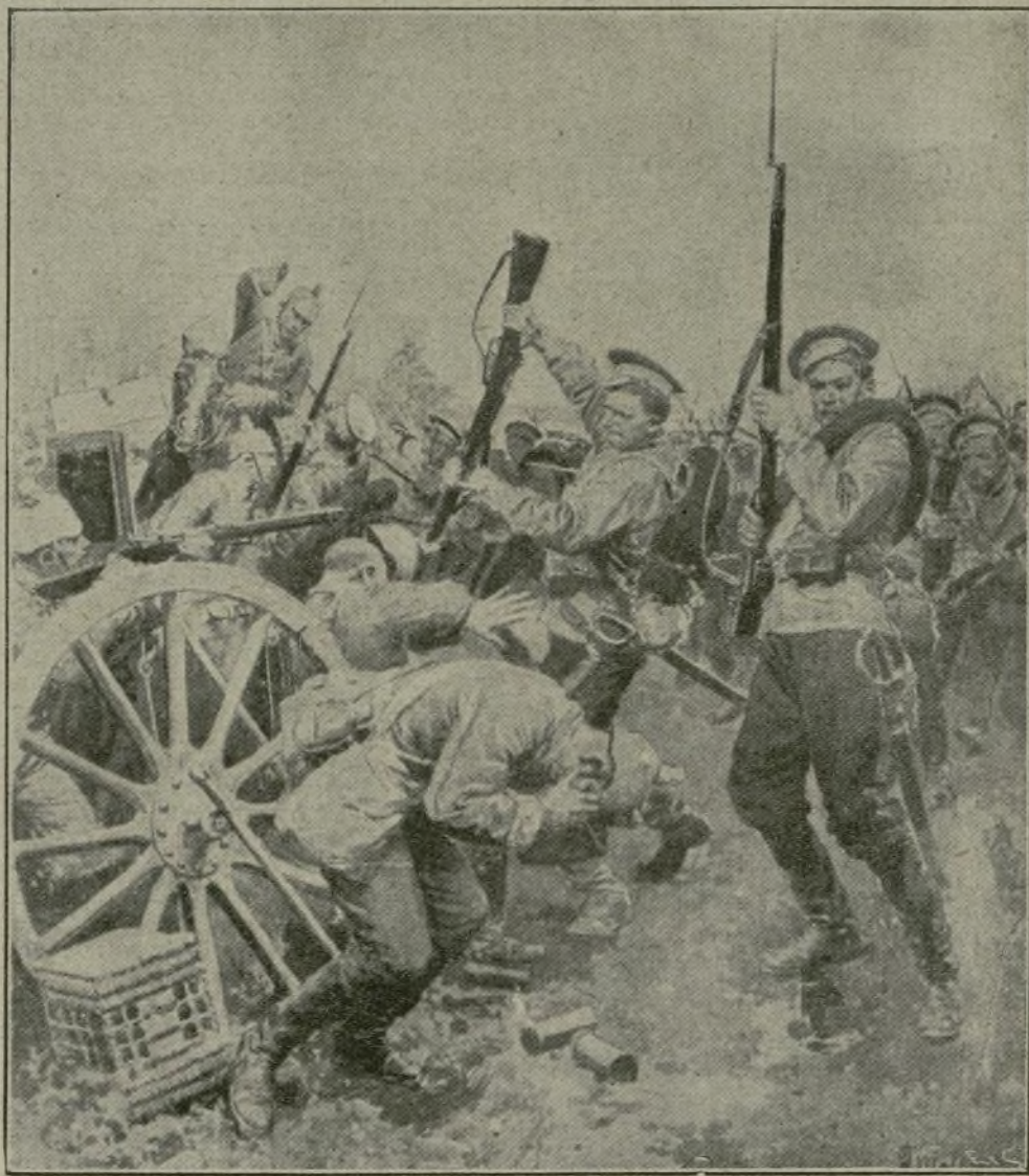
Matania ha reconstituido con escrupulosa exactitud, el cuerpo á cuerpo entre los Ejércitos del Zar y del Kaiser en la frontera ruso-germana, en el momento de lanzarse los rusos á la bayoneta sobre unas trincheras alemanas.