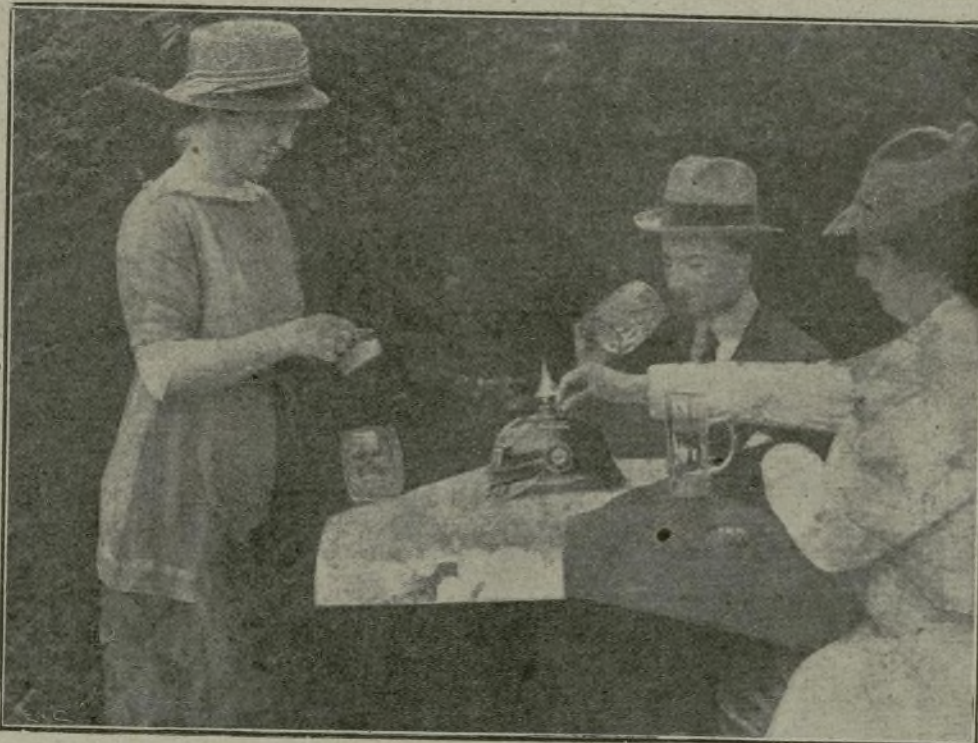
En una de las calles de Berlín se recolectaron, como muestra la fotografía que reproducimos, socorros para los soldados heridos, utilizando para depositar el óbolo popular, un casco agüjereado por las balas.

senta favorable á los aliados, á pesar de haber sido reforzada el ala derecha alemana en la región de Roye.