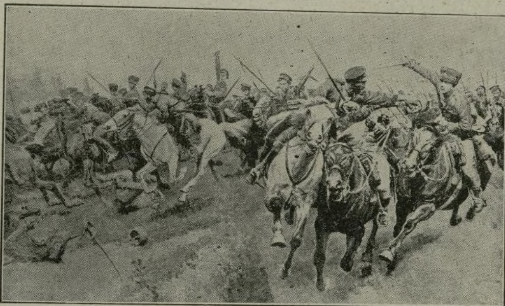
Reconstitución del violento combate librado el 26 de Agosto en Schwansfeld, entre los cosacos rusos y los «húsares de la Muerte», del Ejército alemán.

bas, que causaron tres muertos y 14 heridos. Los aeroplanos franceses no pudieron dar alcance á los enemigos.