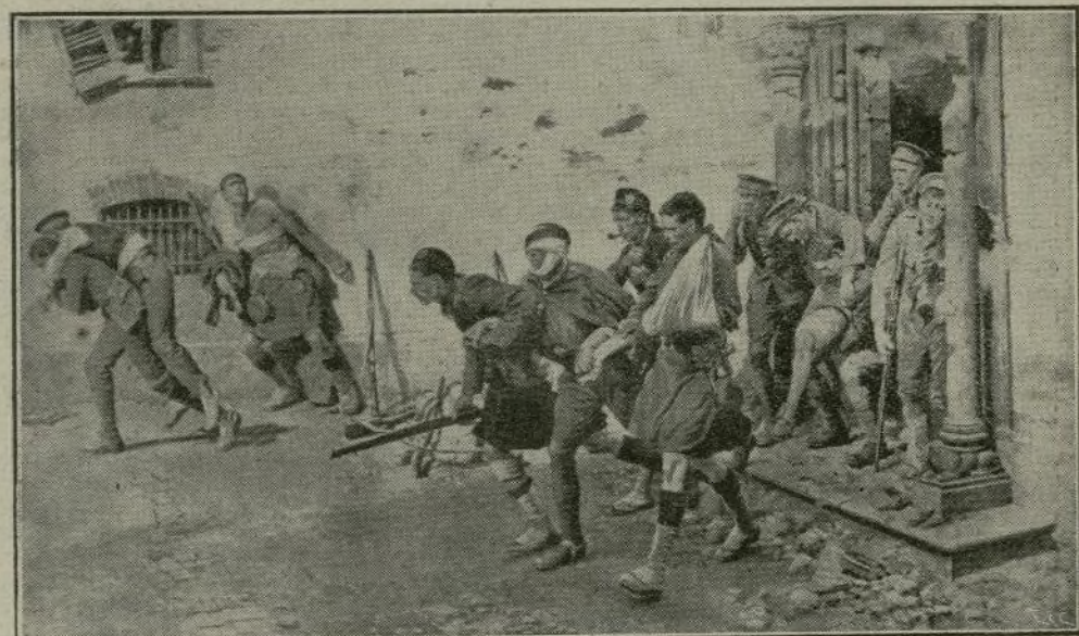
En esta terrible batalla, el fuego del enemigo incendió una pequeña iglesia habilitada por los ingleses para atender á los heridos. El presente dibujo representa el trágico momento de atender al salvamento de ellos, entre el incendio y la metralla.

desconsolador. Bélgica, con sus campos arrasados, paralizados sus talleres y sus fábricas, destruidos sus artísticos monumentos, y perdida casi totalmente su independencia, tan heroicamente defendida desde su Rey al último ciudadano, no puede menos de producirnos esta noble y sincera lamentación.