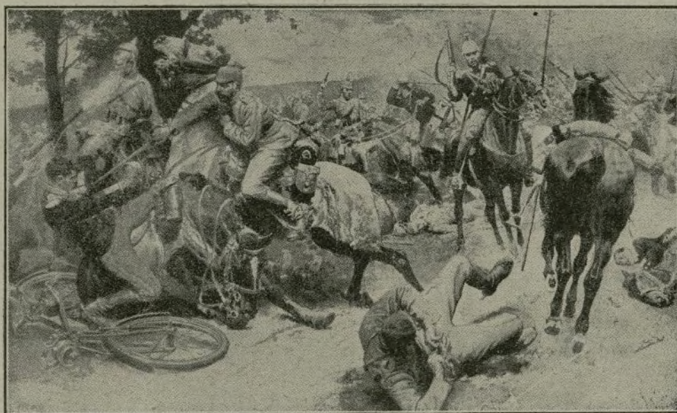
Ataque de un regimiento de lanceros franceses, contra otro prusiano.

lar del salón de Tapices una misa, que oyeron todas las personas reales.