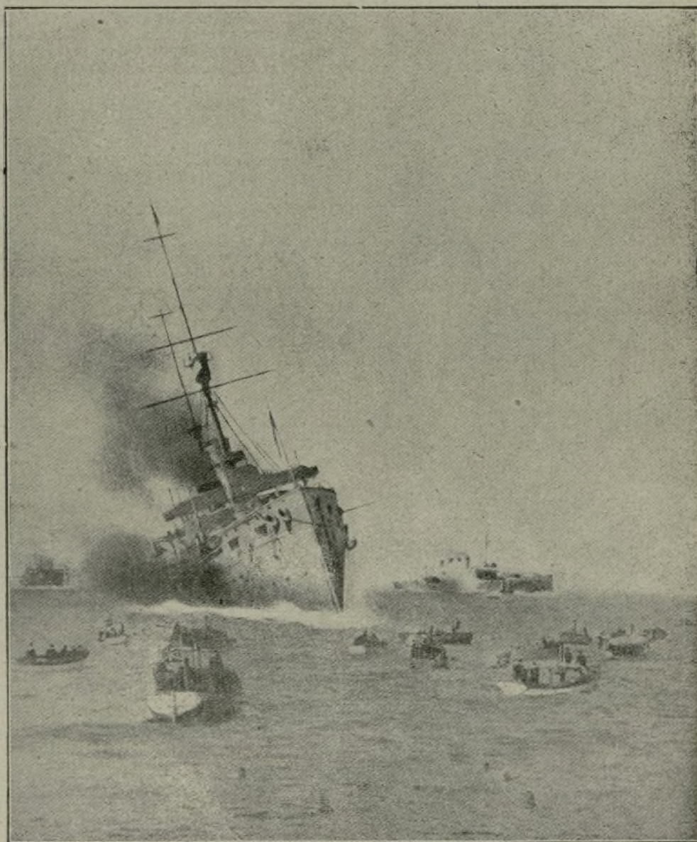
Acorazado echado a pique por un submarino.