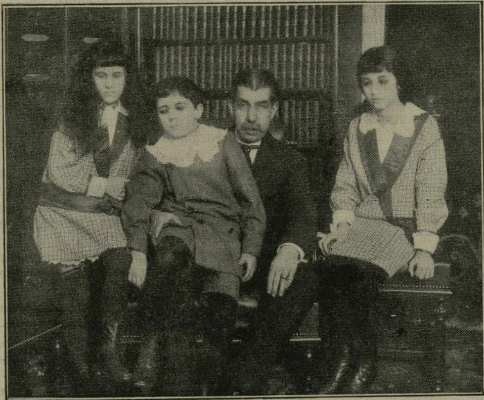
El ilustre exministro D. Francisco Bergamín, con sus nietos.

Mucho tiempo hubiésemos seguido a su lado; pero temiendo pecar ya en la indiscreción, nos alejamos con su venia, después de llevarnos la impresión fotográfica de ese hermoso grupo que ilustra estas ligeras notas, y sugestionados por la amena é instructiva conversación de este hombre ilustre, a quien la Patria le debe no poca parte de la paz que goza.