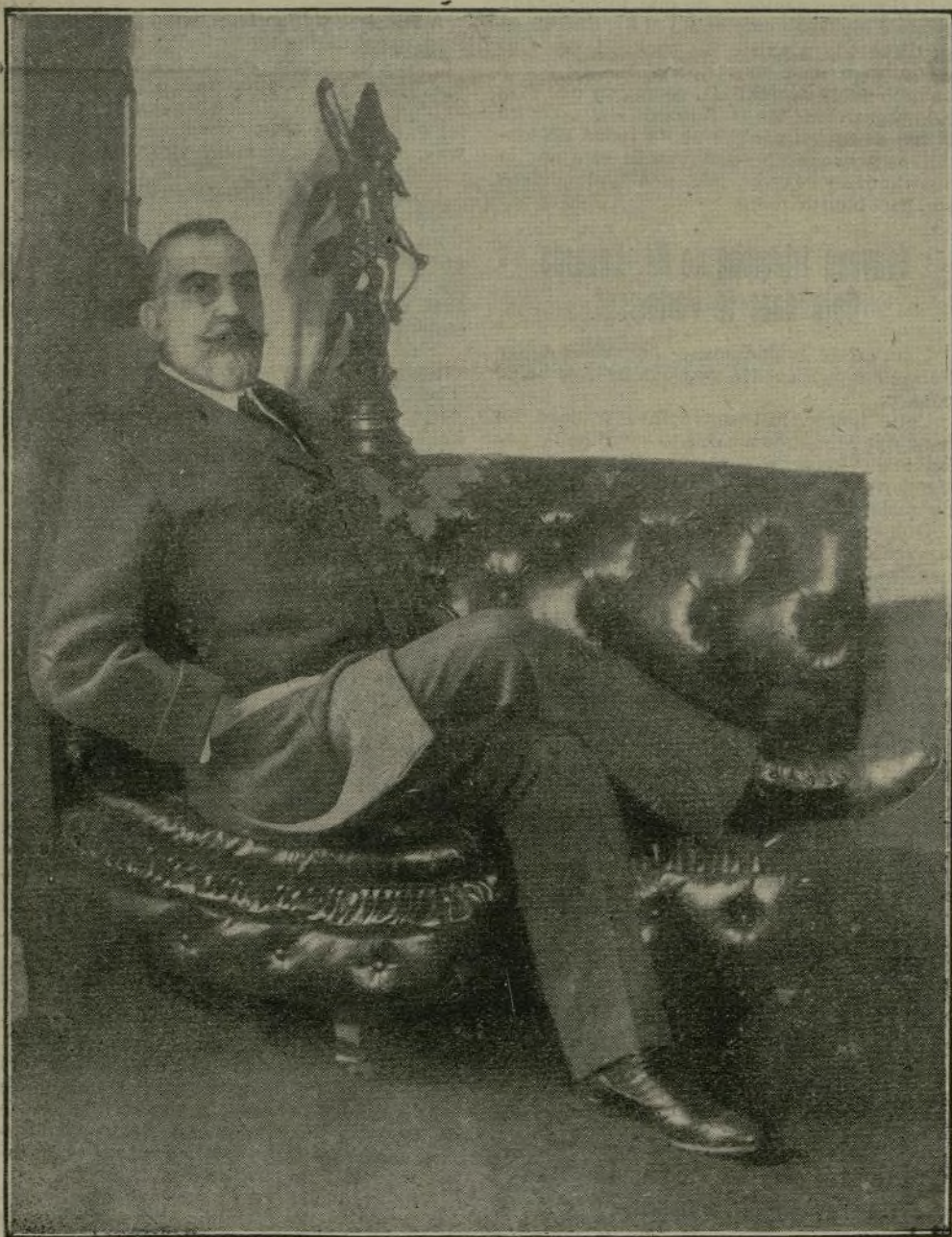
El ilustre Presidente del Congreso, D. Augusto González Besada.

La neutralidad de España no ha sido una solución de fomento y se de la nación. El Gobierno al declarar la guerra se expone al peligro de la Patria. Si otra vez se intentara no prevalecería pues tampoco habría de producirse soluciones; que solo nacen cuando la opinión se divide. diciembre 18. 14 Alf. Besada