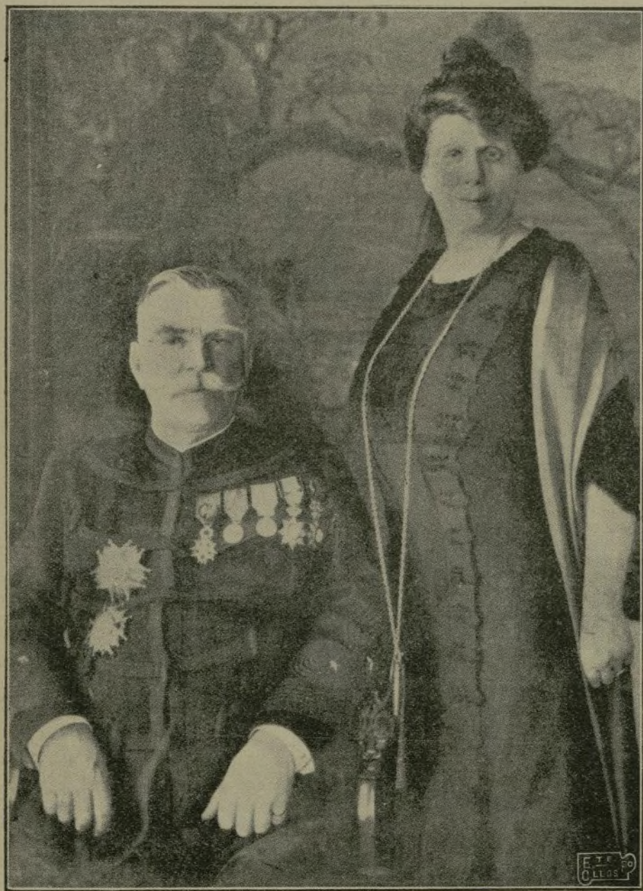
El generalísimo francés Joffre y su esposa.

Recientemente ha sido condecorado; pero la Patria reserva mayores lauros para su ilustre caudillo.