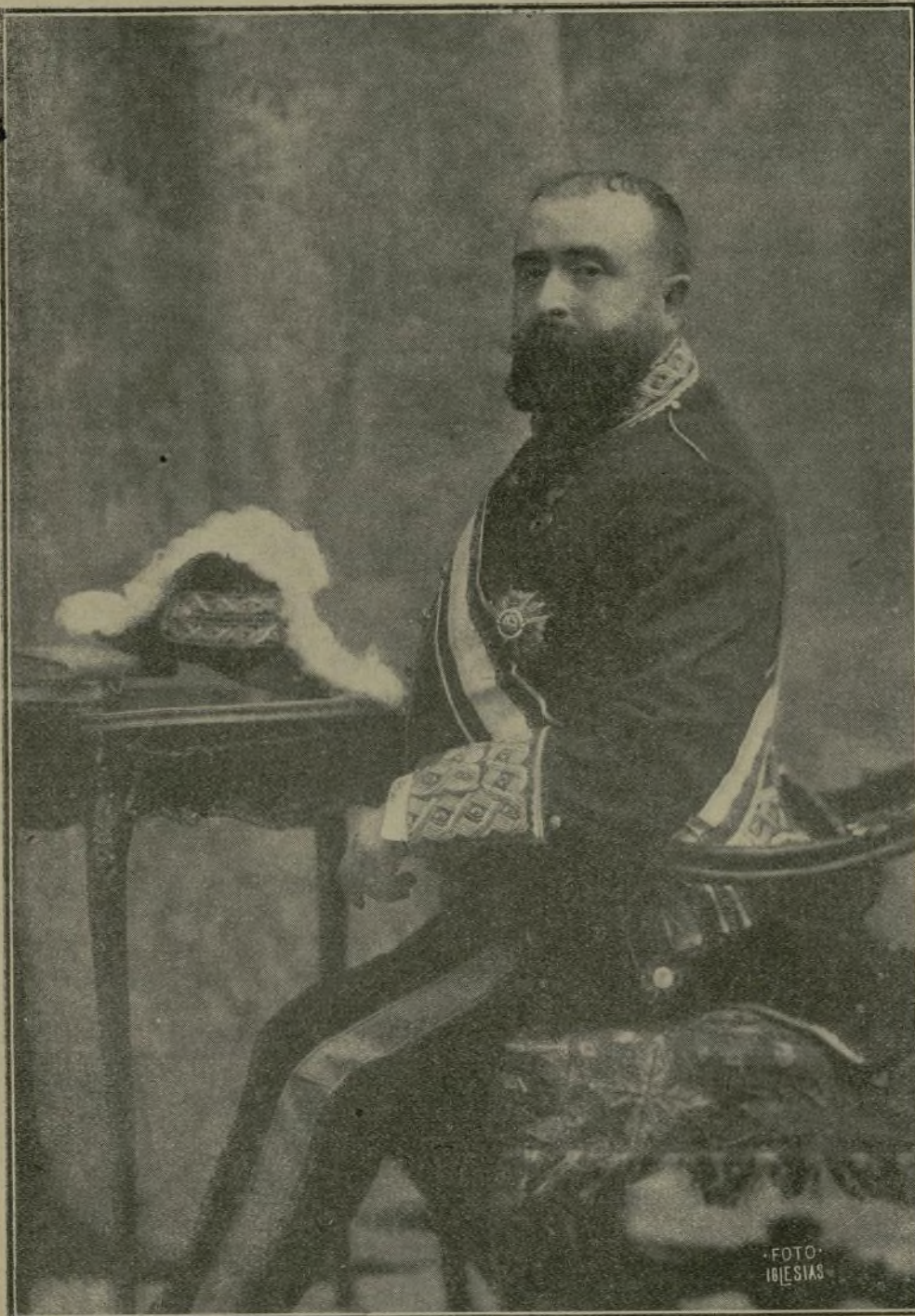
El ilustre ex ministro D. Juan de la Cierva, á cuyas gestiones debe Murcia la Universidad.

del Código civil, relativas á la fundación de bienes con destino á la enseñanza. Y aunque era preciso hacer la clasificación jurídica de dichas Fundaciones, el