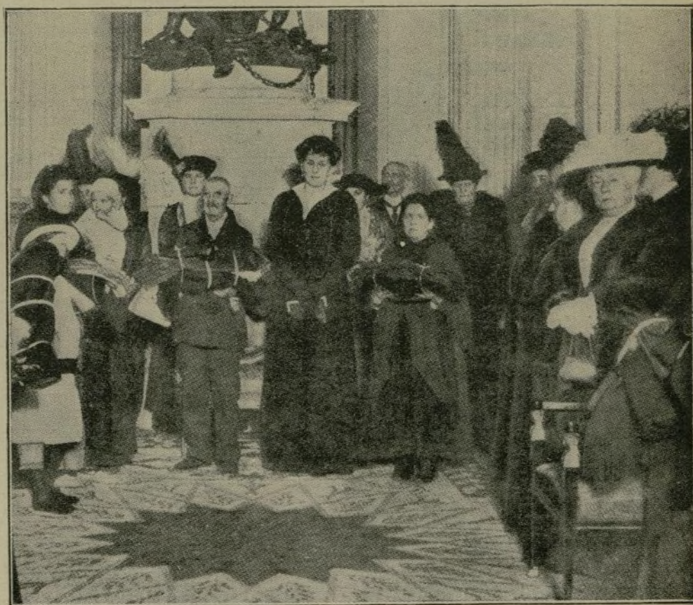
S. M. la Reina D. a Victoria presidiendo el ceremonial de conceder sesenta equipos del Ropero de Santa Victoria á los pobres. Celebrose la ceremonia en el Salón de Columnas de Palacio.