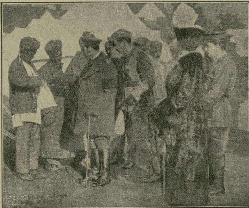
Los Soberanos ingleses visitando un campamento de heridos.