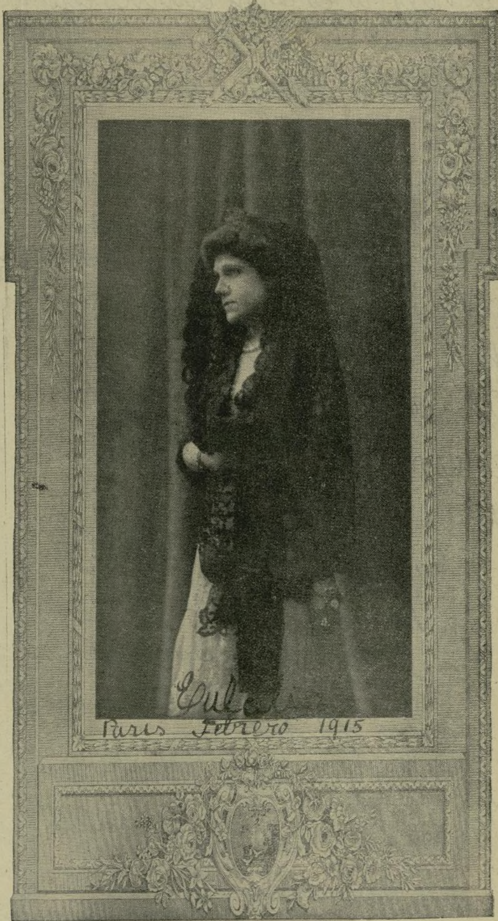
Último retrato de S. A. R. la Infanta de España Doña Eulalia de Borbón, que bondadosamente la augusta Señora se dignó dedicar á "La Monarquía,"

"Sepandados por los horrores de una guerra que trastorna pueblos y naciones, nos