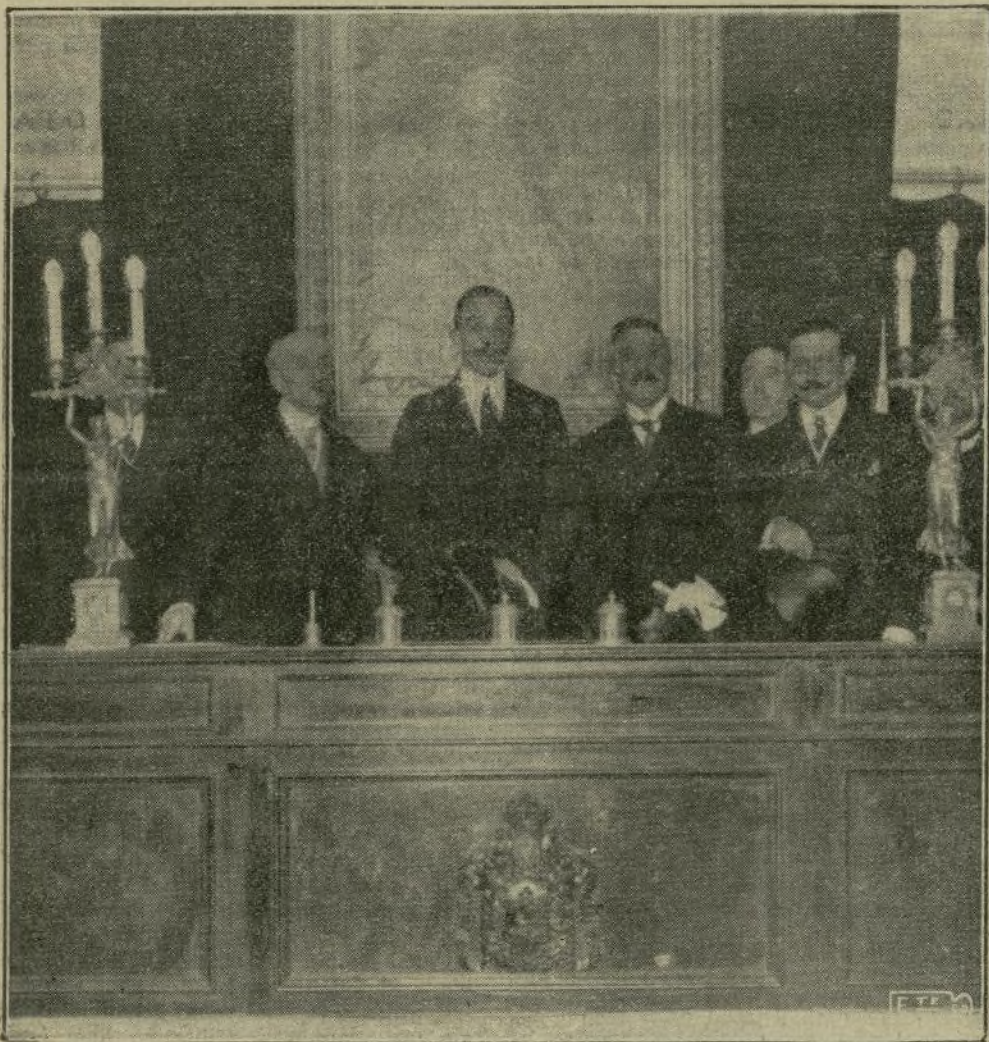
S. M. el Rey, acompañado del presidente del Consejo de Ministros, el Sr. Alcalá Zamora, el Sr. García Prieto y otras personalidades, presidiendo el reparto de premios á los alumnos del Centro Instructivo del Obrero, efectuado en la Academia de Jurisprudencia el 21 del actual.

NUESTRO MONARCA SECUNDA LA HERMOSA LABOR SOCIAL QUE INICIO D. EDUARDO DATO PARA BENEFICIO DE LOS OBREROS ESPAÑOLES