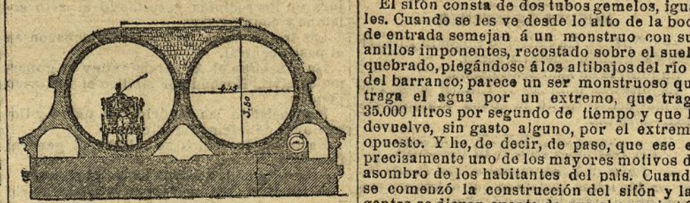
Sección de los dos tubos gemelos que forman el sifón y de sus galerías interiores para reconocimiento y recoger las filtraciones

El tubo de palastro es, algamosí, así, el alma del sifón. Ese tubo lleva por dentro un revestimiento de hormigón armado de 22 milímetros de grosor. Este enlucido deja al me-