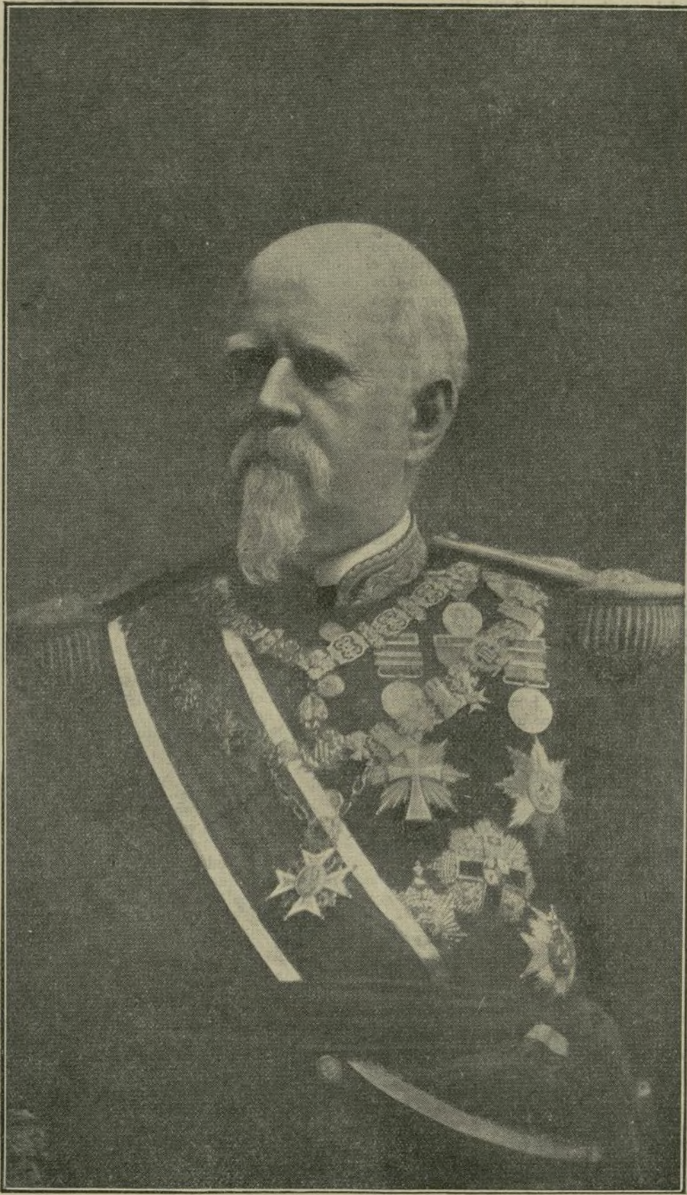
Último retrato del patriota D. Marcelo de Azcárraga, que tantos servicios prestó en vida á España y al Trono.

Es muy pronto, cuando apenas se ha cerrado su sepultura para hacer el juicio de un hombre á quien las circunstancias han hecho intervenir—á veces contra su deseo—en los más graves acontecimientos políticos que se han desarrollado en