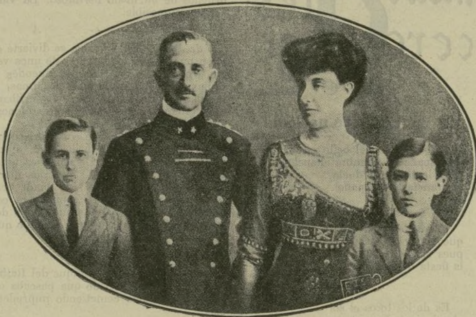
El duque de Aosta, primo del Rey de Italia y general en jefe del ejército italiano, con su esposa la princesa Elena de Orleans y sus hijos.

mistas reconozcan como su voluntad perseverante y tenaz, la acción continuada, consigue atraer á los moros y ensancha la zona.