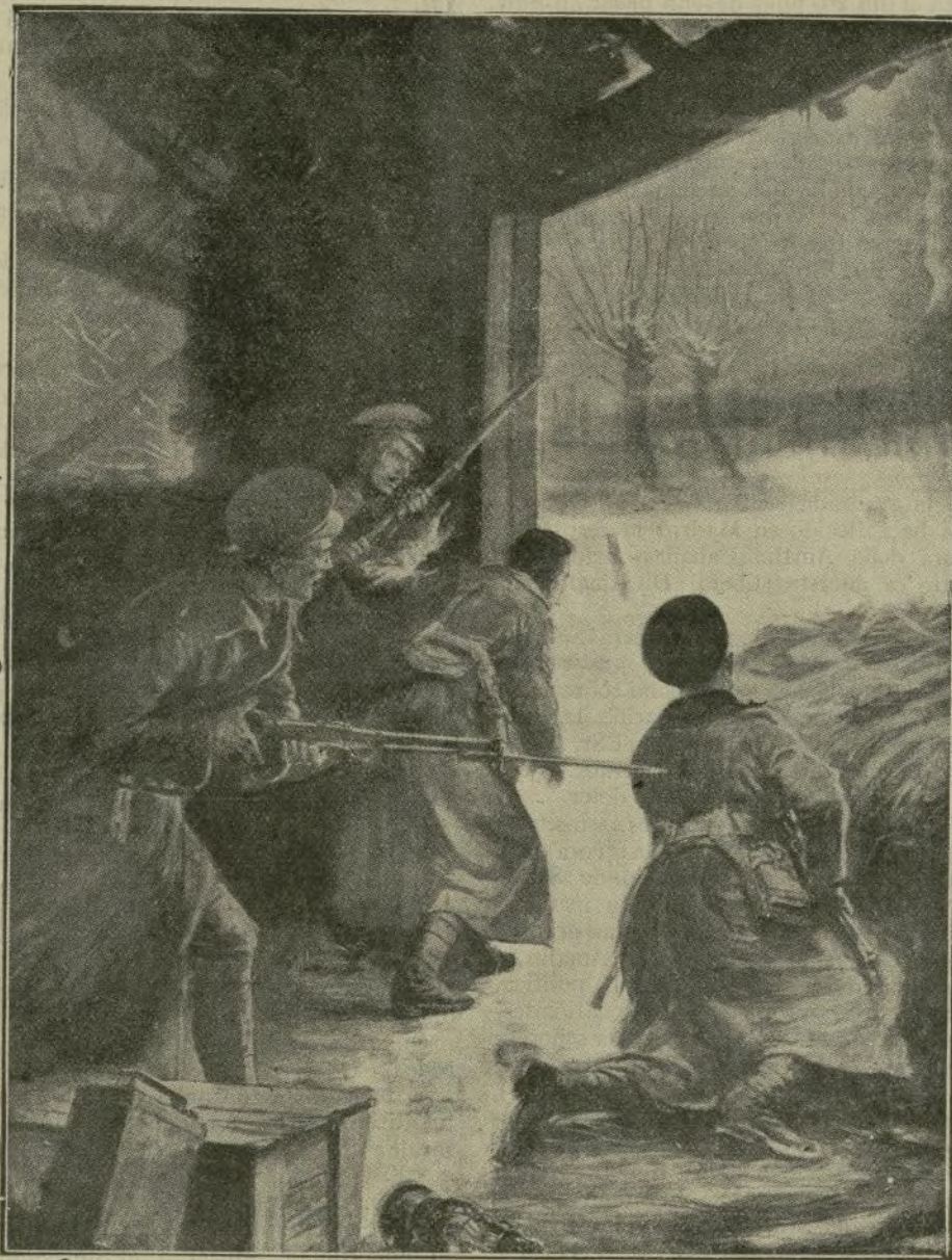
Los alemanes sorprendiendo con el auxilio de la niebla un puesto avanzado de observación inglés.

El general francés Gourand, que asumía el mando de los aliados, ha sido herido por unos cascos de granada, sustituyéndole el general Baillod, que estaba en la reserva antes de la guerra.