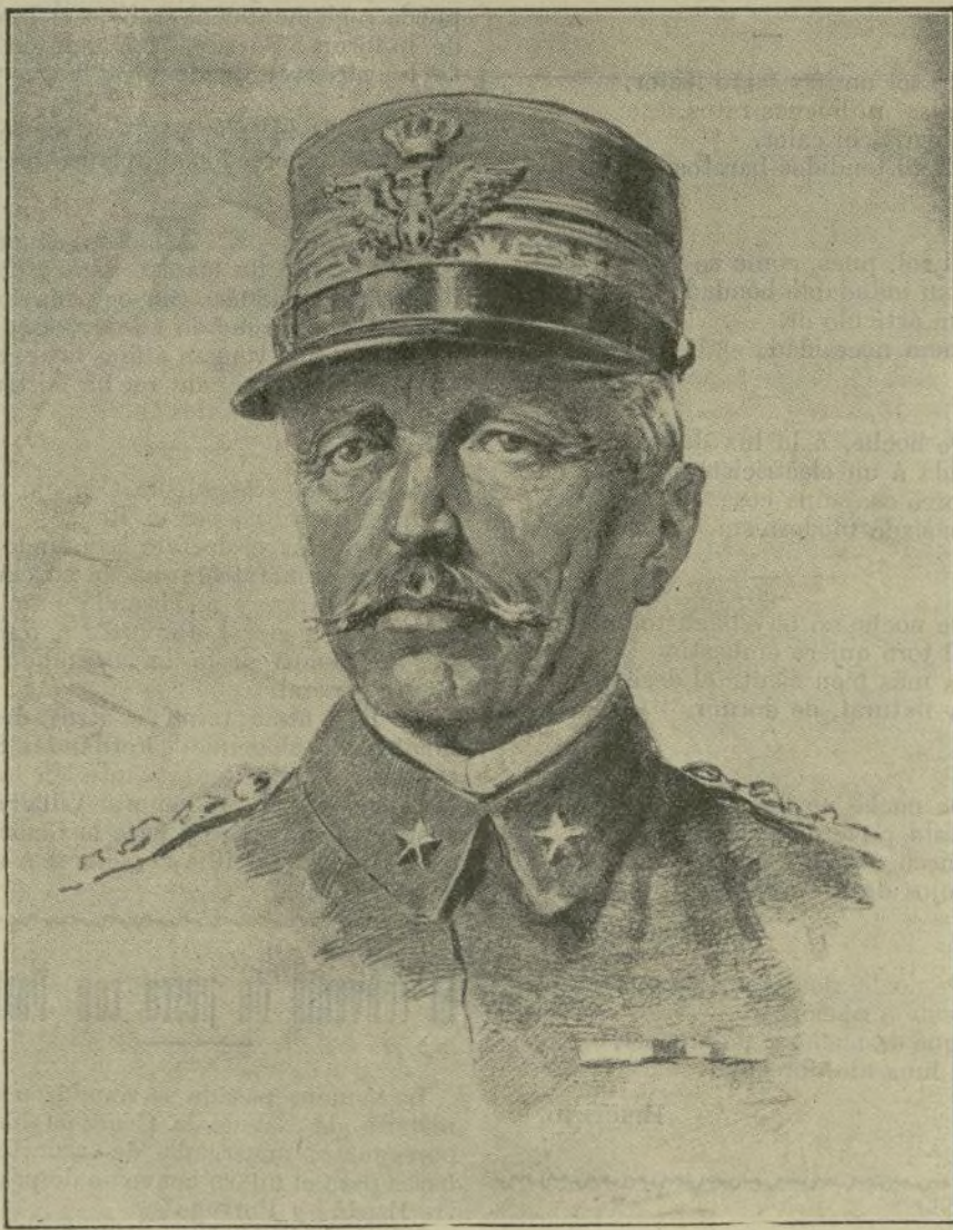
El general Luis Cadorna, comandante en jefe de las tropas italianas que operan contra las austriacas.

el monte que rodea á Argaia, sin que ocurriera novedad en la posición.