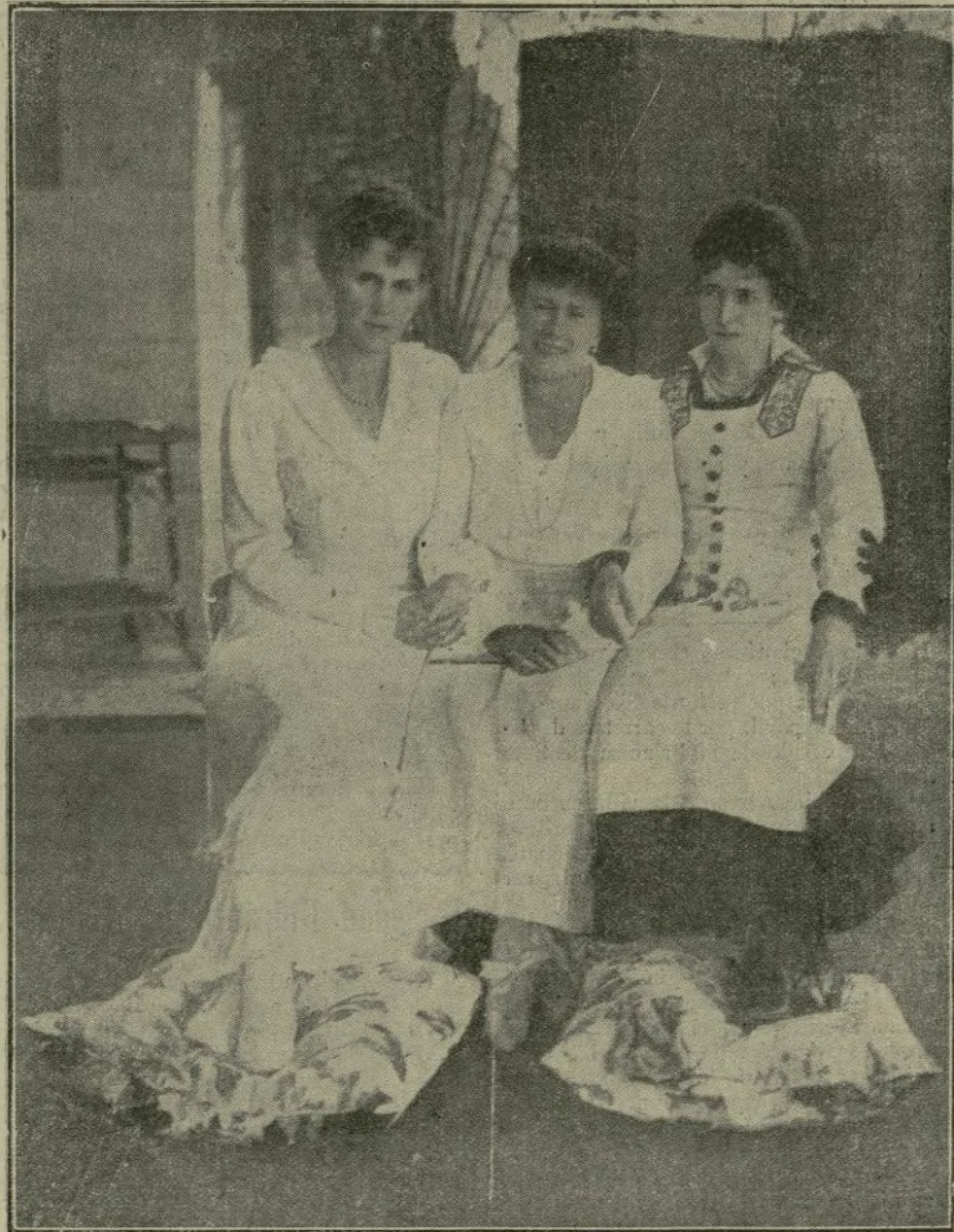
S. M. la Reina Doña Victoria y SS. AA. la Infanta doña Beatriz y la Princesa de Salm Salm, en el Palacio de la Magdalena.