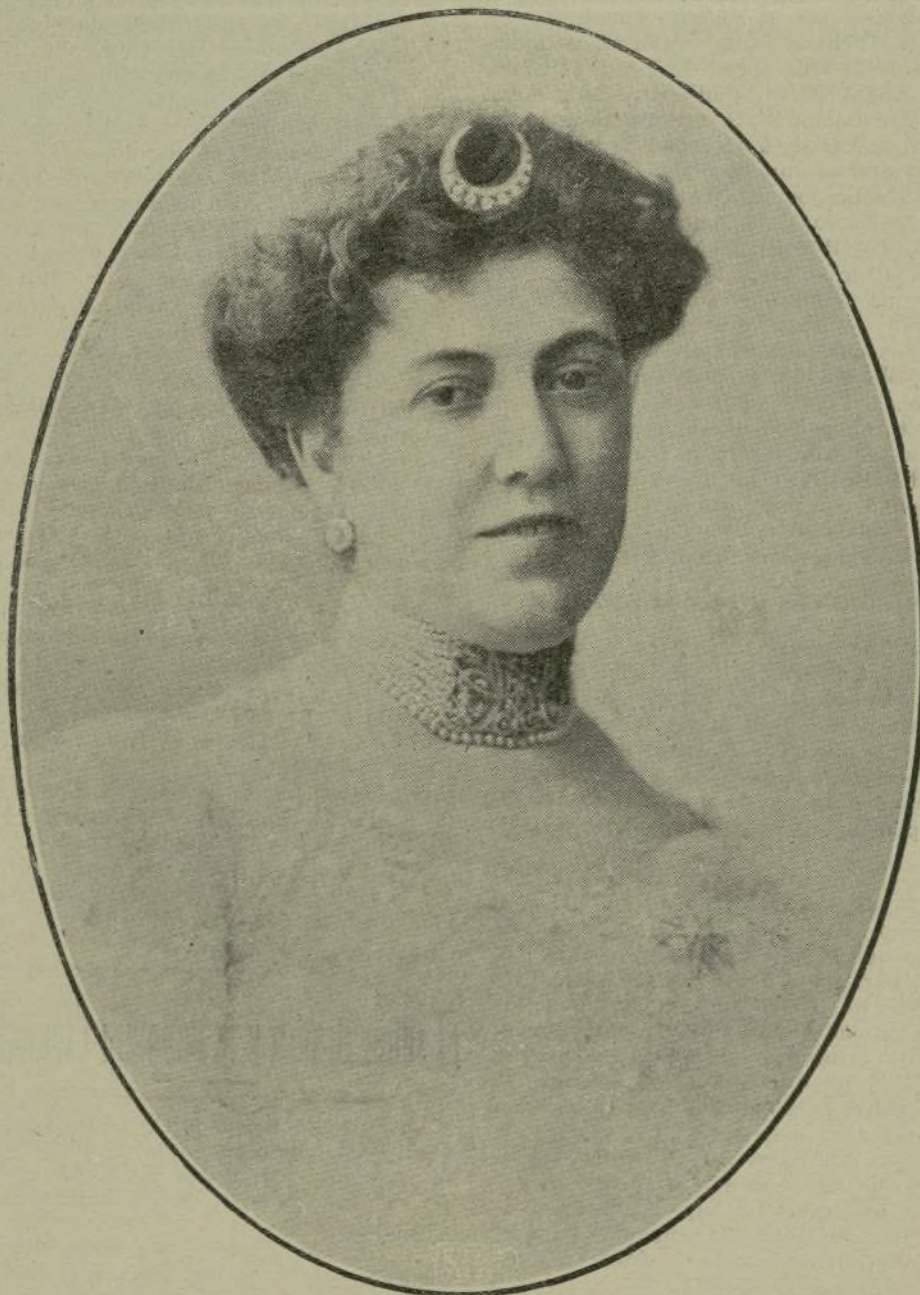
Excma. señora Vizcondesa de San Antonio, que pide la paz europea en el libro de «La Monarquía».