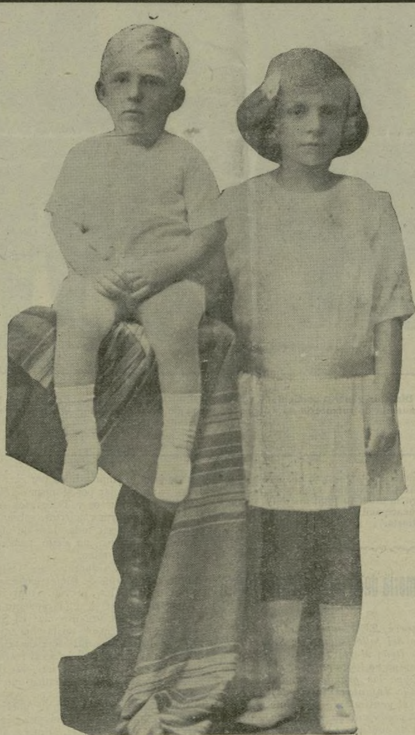
SS. AA. RR. los Infantitos Don Juan y Doña Beatriz.

Reciente fotografía obtenida por Franzen.