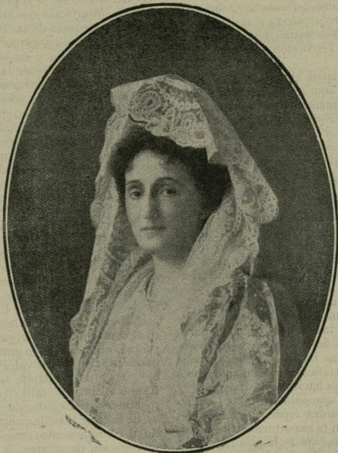
Excma. Sra. Duquesa de Sueca.

Si las mujeres de las naciones beligerantes no pueden pedir la paz para que no sea interpretado este acto como un sentimiento de cobardía ó egoísmo, por ver perecer á los seres más queridos de su corazón, las de España, nación neutral, la piden rogando á los representantes de esas naciones y de los poderes públicos que atiendan esta súplica al dirigir su mirada á tantos hogares vacíos por causa de la guerra, donde se sufre y llora; y que lo hagan recordando que el Divino Maestro, al recomendararnos la paz, nos dejó en testamento estas hermosas palabras: Amaos los unos á los otros.