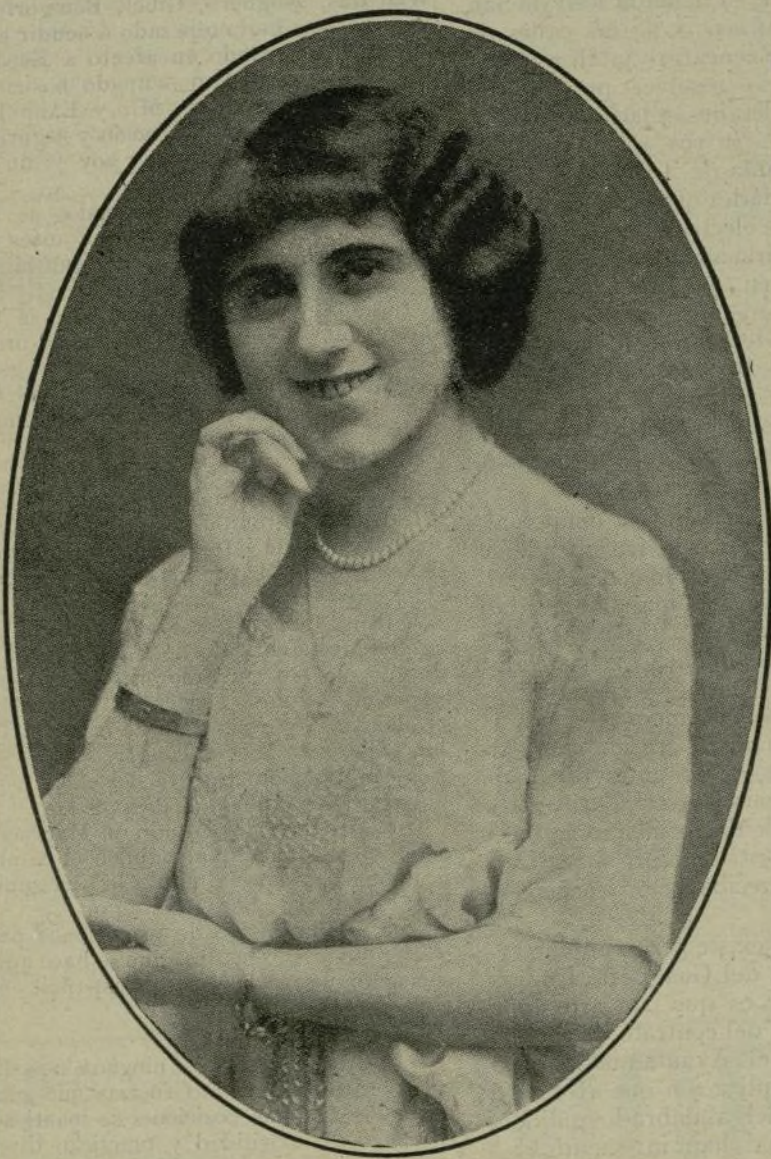
Excma. Sra. Condesa de Sierrabella.