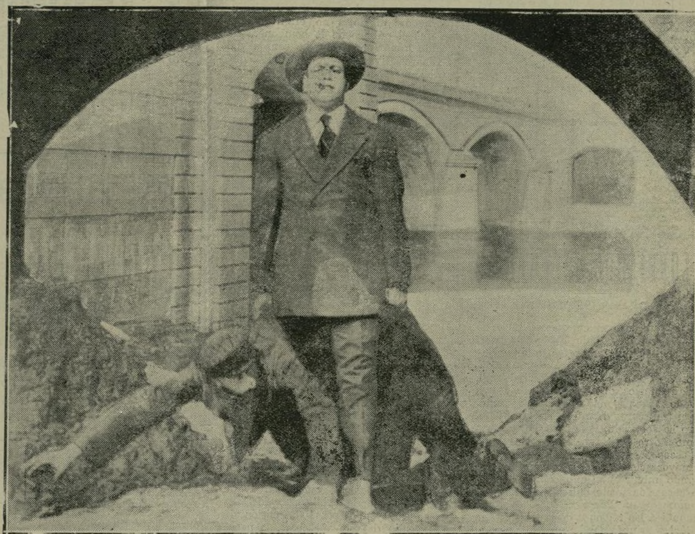
Un momento interesante de MACISTE

Maciste se estrenó ayer en el Gran Teatro. Mañana domingo aparecerá nuevamente sobre la tela de proyecciones, á las tres y media, cinco y seis y media de la tarde y á las nueve y media de la noche, en cuatro grandes secciones.