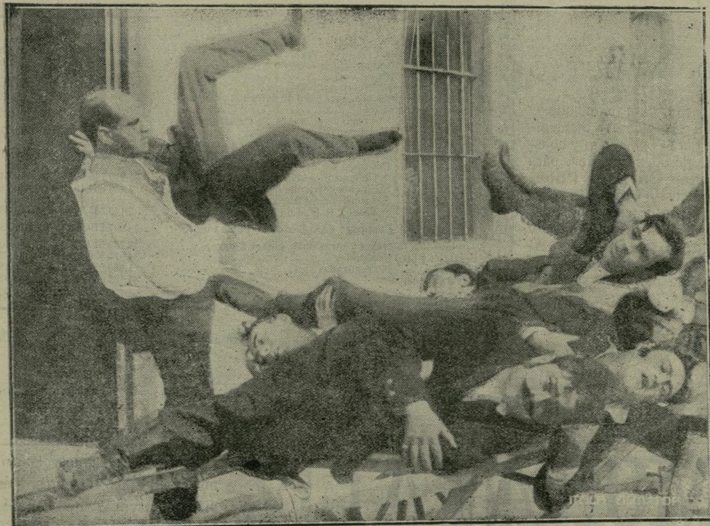
Emocionante escena de MACISTE