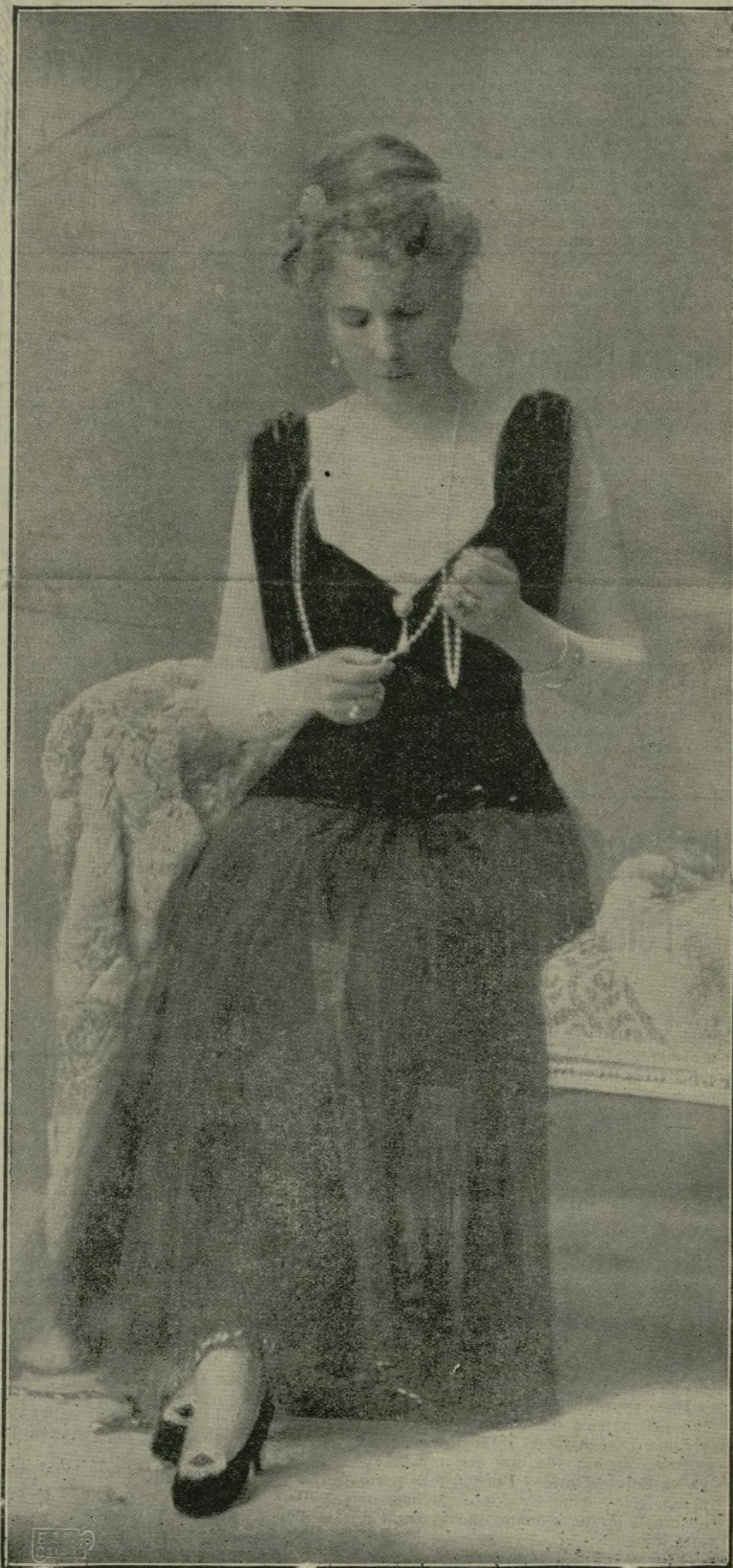
Retrato que há pocos días hizo de nuestra Soberana el gran artista Sr. Franzen.