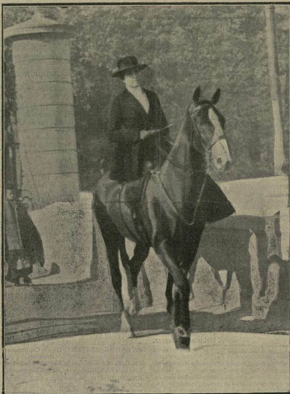
S. M. LA REINA DOÑA VICTORIA EN UNO DE SUS PASEOS MATINALES POR LA CASA DE CAMPO