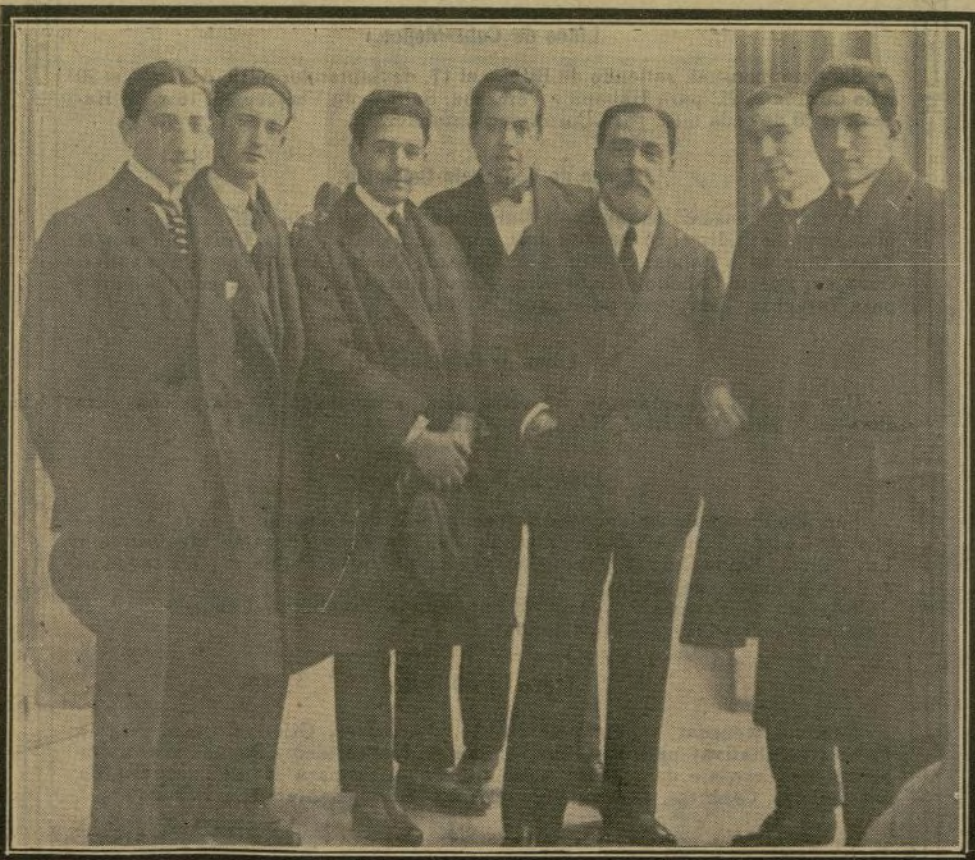
Una Comisión de estudiantes ha visitado al ministro de Instrucción pública, don Julio Burrell, para testimoniarle su gratitud por el beneficio que les reporta el Real decreto de supresión de reválidas. El Sr. Burrell acogió cariñosamente a la Comisión, agradeciendo mucho semejante demostración de simpatía.