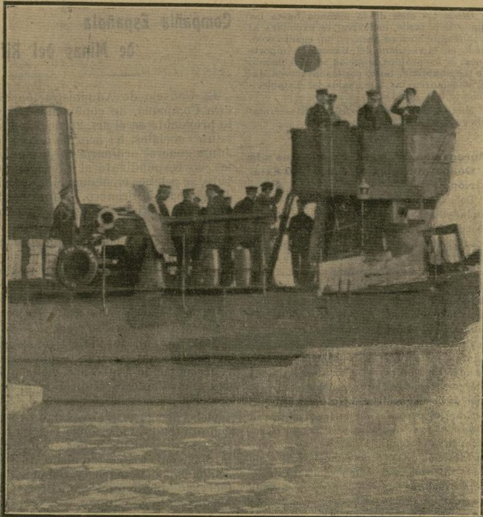
S. M. D. Alfonso XIII a bordo del Torpedero número 11, después de su visita al Arsenal de la Carraca.

El Monarca recomendó a los nuevos oficiales optimismo y fe en el porvenir de España.