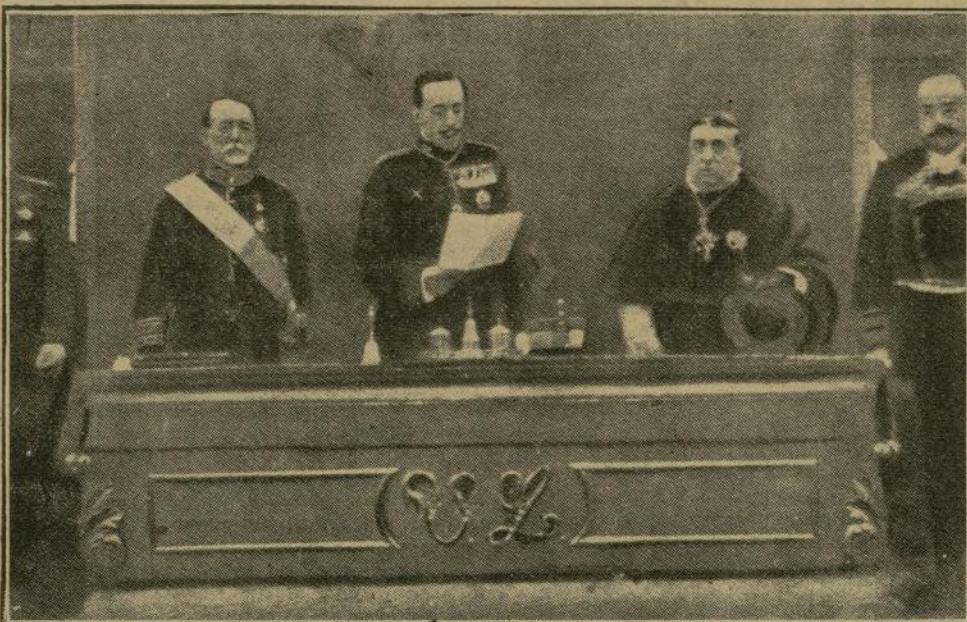
El Soberano leyendo su discurso en la solemne sesión celebrada en el Instituto Nacional de Previsión, en Sevilla.]

Me complace en enviar a todos cuantos laboren en esta intensa acción de previsión social el testimonio de mi simpatía y mi aplauso, siéndome especialmente grato expresar estos sentimientos a los insignes patricios sevillanos y a todos los elementos de esta amada ciudad, que con celo insuperable vienen trabajando en esta admirable obra patriótica y humanitaria, y educando en ella a las nuevas generaciones.