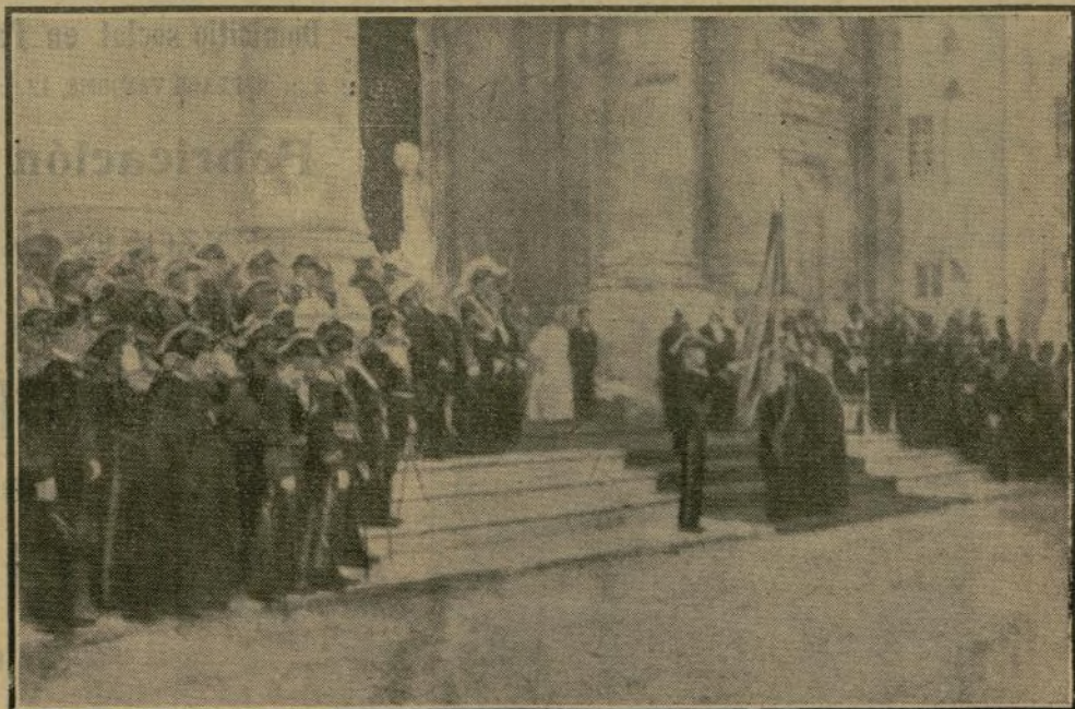
S. M. D. Alfonso XIII presenciando la jura de bandera de los nuevos Oficiales de la Armada.