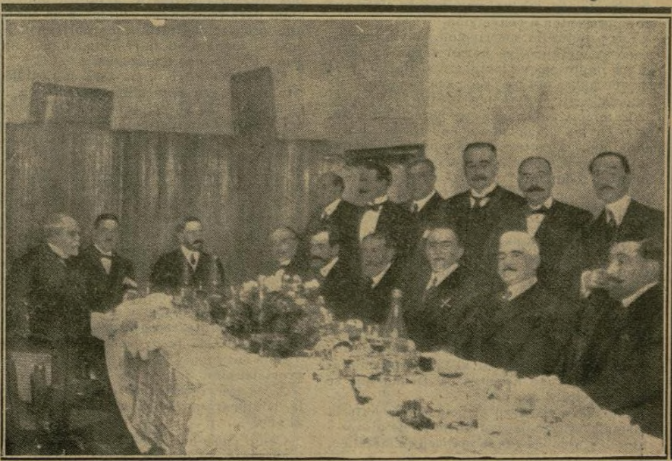
Banquete ofrecido al ministro de la Gobernación D. Joaquín Ruiz Jiménez, por los senadores y diputados de la provincia de Sevilla, en dicha capital.