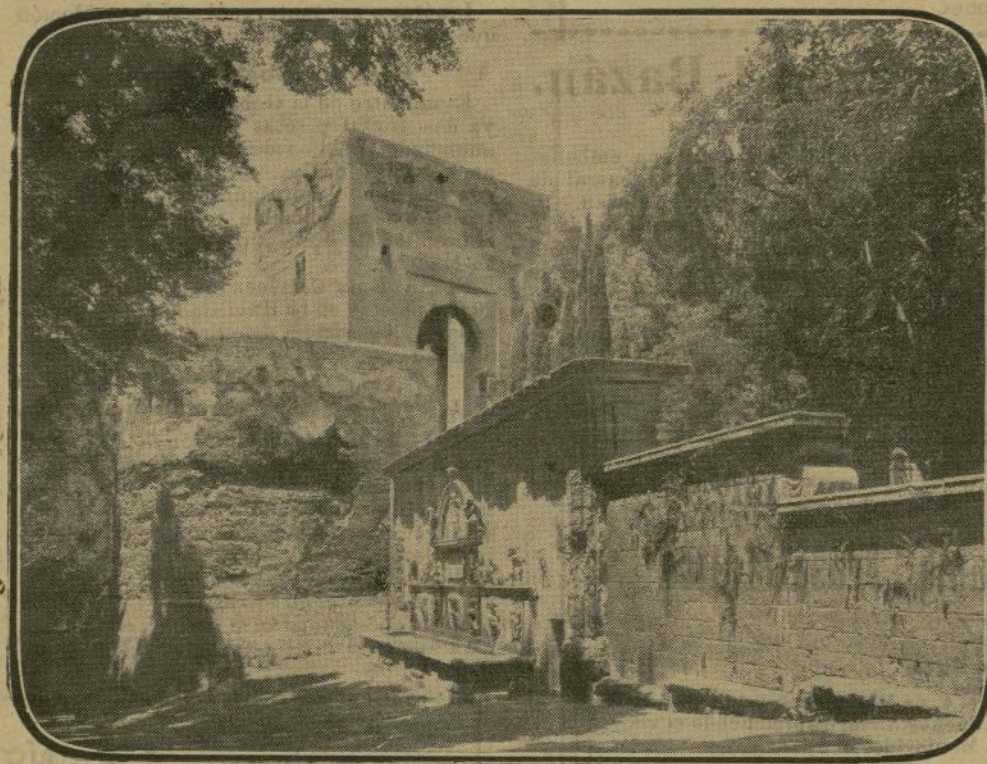
Alhambra.—Pila de Carlos V y Puerta Judiciana.

peonías, jacintos, alalies, claveles y otras flores, cuyos nombres desconocemos.