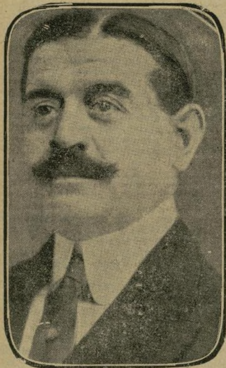
D. Luis Silvela. Alcalde de Madrid.