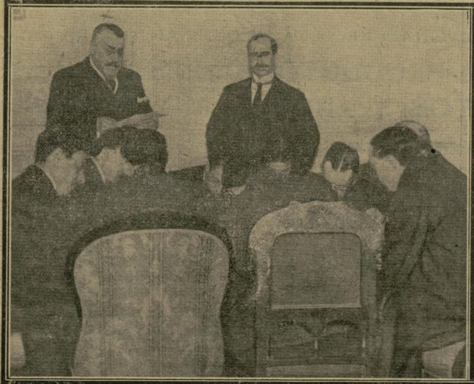
D. José Francos Rodríguez (x) dando a la prensa la nota oficiosa del primer Consejo de ministros celebrado por el actual Gobierno.