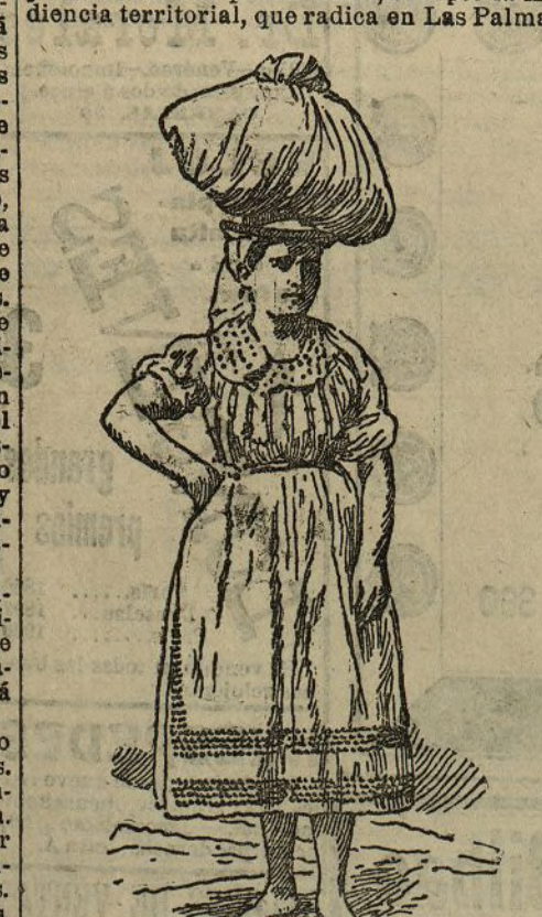
CANARIAS.—Lavandera de Tenerife

Al cabo ha venido a reconocerse también que la influencia extranjera no existe. Si los negocios comerciales en Canarias los han acaparado ingleses y alemanes, culpa ha sido también del olvido en que se tuvo siempre a Canarias, hasta muy próxima fecha, en que con patriótico acuerdo hemos puesto atención en la vida y el porvenir de aquella lejana provincia. Y hemos caído en la cuenta en que, mientras otras naciones facilitaban el tráfico y las transacciones comerciales, favoreciendo a Canarias, al dar transportes económicos y mercados prósperos a los produc-