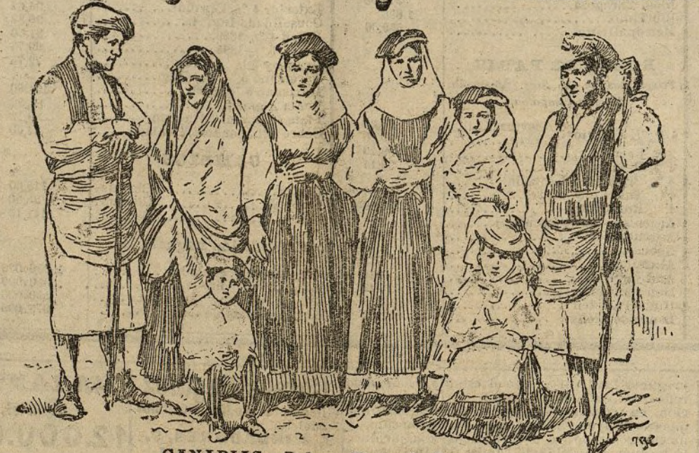
CANARIAS.—Palma. Tipos de Pantallana

Contemplada esta ciudad desde el mar, es en extremo pintoresca.