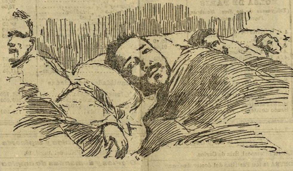
Henry Nemi, el capataz salvador de los 13 mineros sepultados veinte días en la mina número 2 del subsuelo de las minas de Courrières