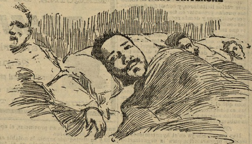
Henry Nemi, el capataz salvador de los 13 mineros sepultados veinte días en la mina número 2 del subsuelo de las minas de Courrières