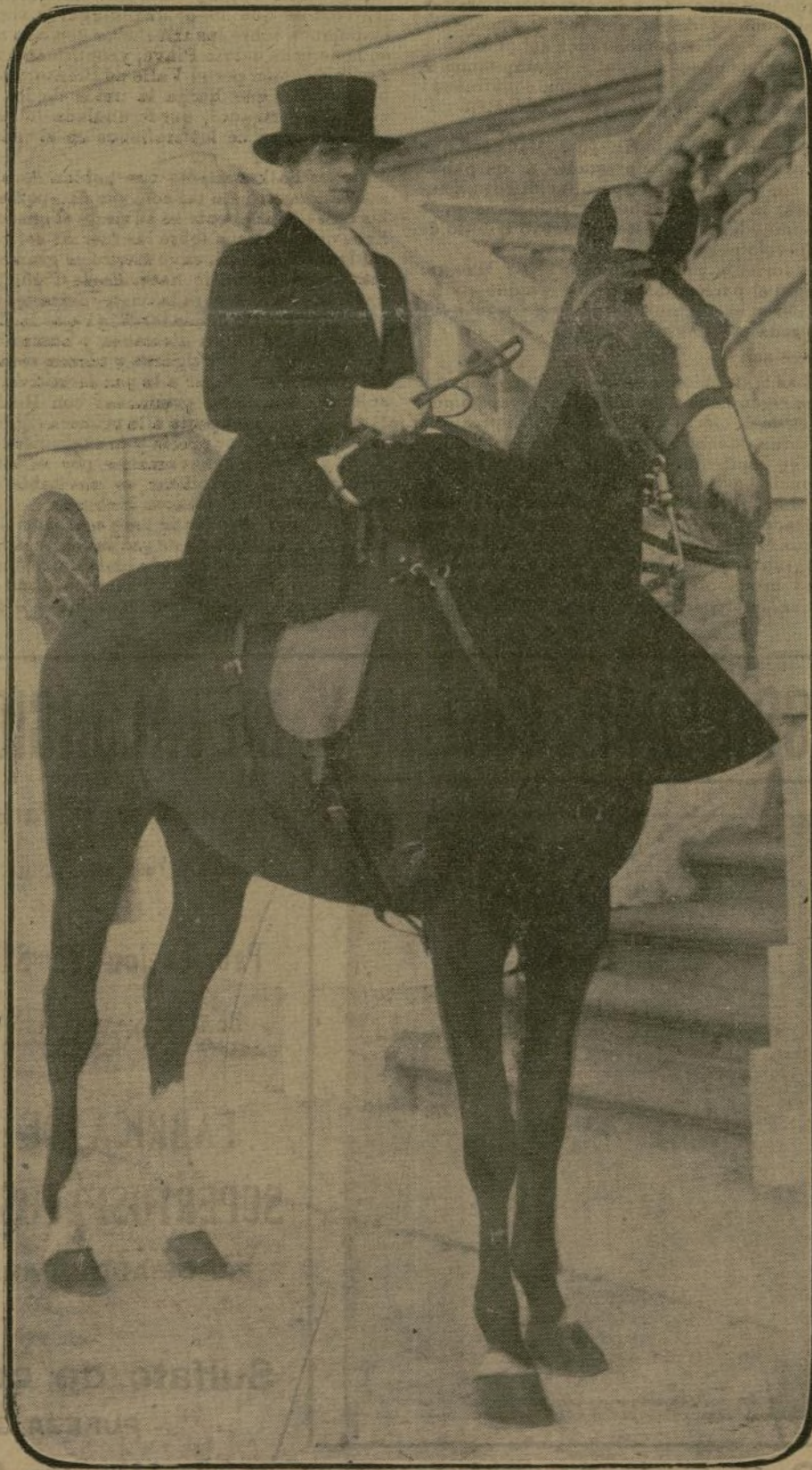
Reciente fotografía al salir S. M. la Reina de Palacio para dar un paseo por la Casa de Campo.

La cualidad de diputado no le exime del deber de ser sincero y hacer justicia al Ejército, que siente, como le corresponde, los nobles estímulos de la equidad, de la justicia y de la piedad para esos mismos que, como el Sr. Domingo, buscan plataforma al amparo de su investidura para denostarle injustamente; el Ejército anhela una España bien gobernada y administrada, libre de taifas y oligarquías; un España respetada den-