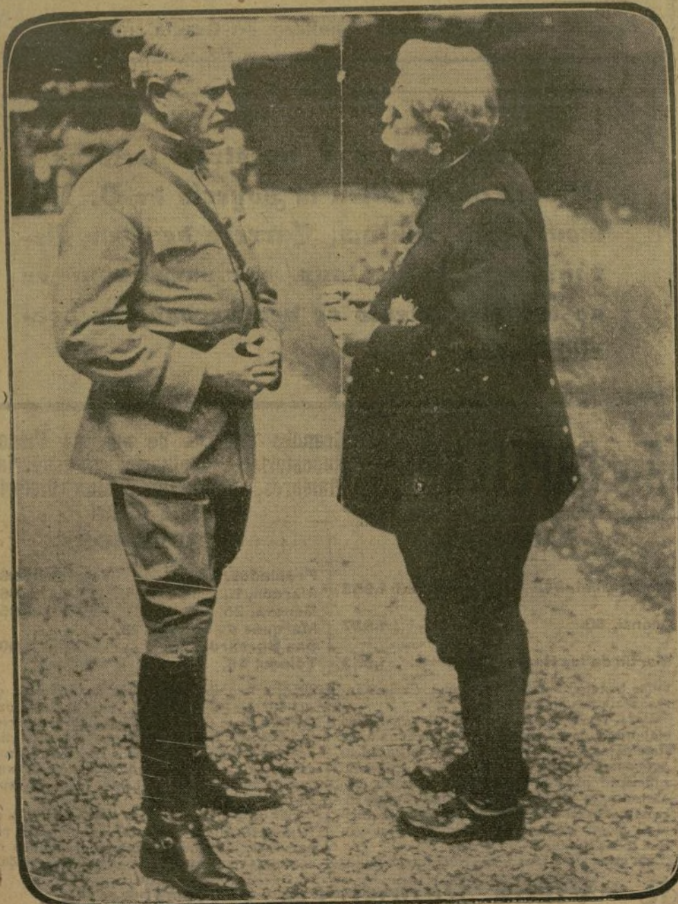
Jofre conversando con Pershing. Interesante fotografía de estos dos hombres y bravos soldados, de quienes la prensa mundial se ha ocupado largamente y a los que han calificado los norteamericanos de: «El conquistador de ayer y el de mañana». Ambos generales acusan a los ojos del mundo un relieve poderoso. Son dos figuras de duradera actualidad aureoladas por el nimbo de la responsabilidad y de la polvora. Dos conquistadores de estos tiempos que tan florecientes eran y tan fatales se tornaron para la marcha de los pueblos.