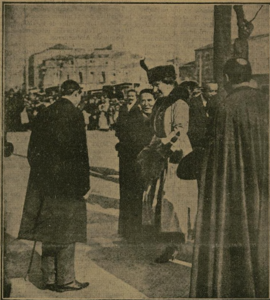
S. M. la Reina Doña Victoria al llegar al Colegio de Nuestra Señora del Pilar, en los Cua- tro Caminos, donde distribuyó raciones entre los pobres.

S. M. la Reina Doña Victoria continúa, infatigable, su generosa obra emprendida en favor de los pobres. Los llamados Comedores de Caridad, son una muestra admirable de cuan- to la Soberana labora por el bien de los humildes. Reunió en Palacio a las más ilustres damas de la nobleza española, hizo un llamamiento a sus corazones, encabezó con veinti- cinco mil pesetas la suscripción y ésta ha llegado a alcanzar una suma verdaderamente importante. Merced a tan piadosa iniciativa, que permite distribuir diariamente más de 3.000 raciones, los pobres de Madrid tienen pan este invierno. La caridad de la Reina conquista cada vez más nuevos galardones: los que le tributan, la gratitud y el respeto de los menesterosos, de los que reciben de manos de la augusta señora el auxilio que han menester.