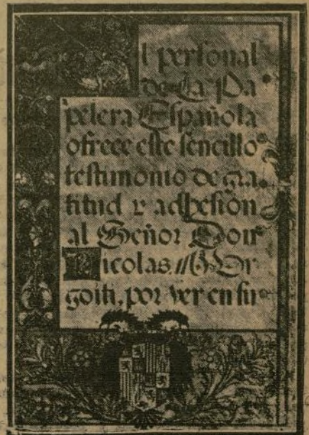
Portada del álbum que lleva las firmas de los empleados y obreros de la Papelera Española.

je al florecimiento de la industria del papel, dedican esta prueba de admiración y agradecimiento, los empleados de La Papelera Española.