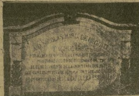
Lápida conmemorativa de la inauguración de la fábrica de Rentería, que ha sido descubierta el día 9 del actual, con motivo de las bodas de plata del director de la Papelera Española.

Con motivo de la celebración de sus bodas de plata, el ilustre presidente de la Papelera Española ha sido objeto de una