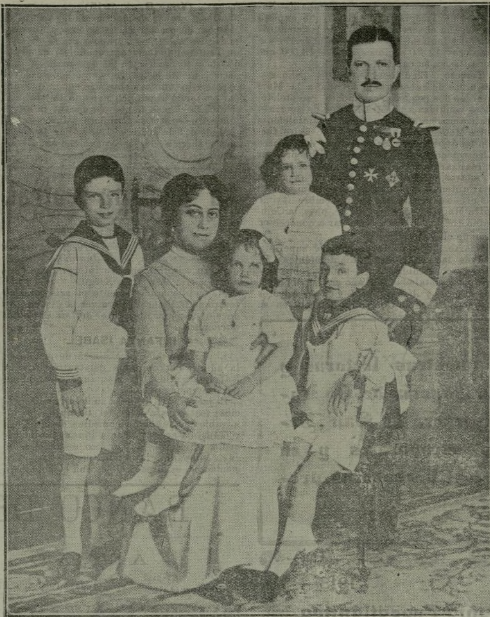
El Infante D. Fernando con su esposa la duquesa de Talavera y los cuatro hijos de su primer matrimonio, entre los que se ve a la infantita Pilar (x).—(Reciente fotografía de Campúa).

El Liberal , al saludarlos, recuerda la frase del Eclesiastes , y dice que hay tiempo para amar y tiempo para aborrecer. Pero nosotros no vemos en los amnistiados que tengan tiempo más que para el cultivo y acrecentamiento de sus rencores, ya que sólo usan la