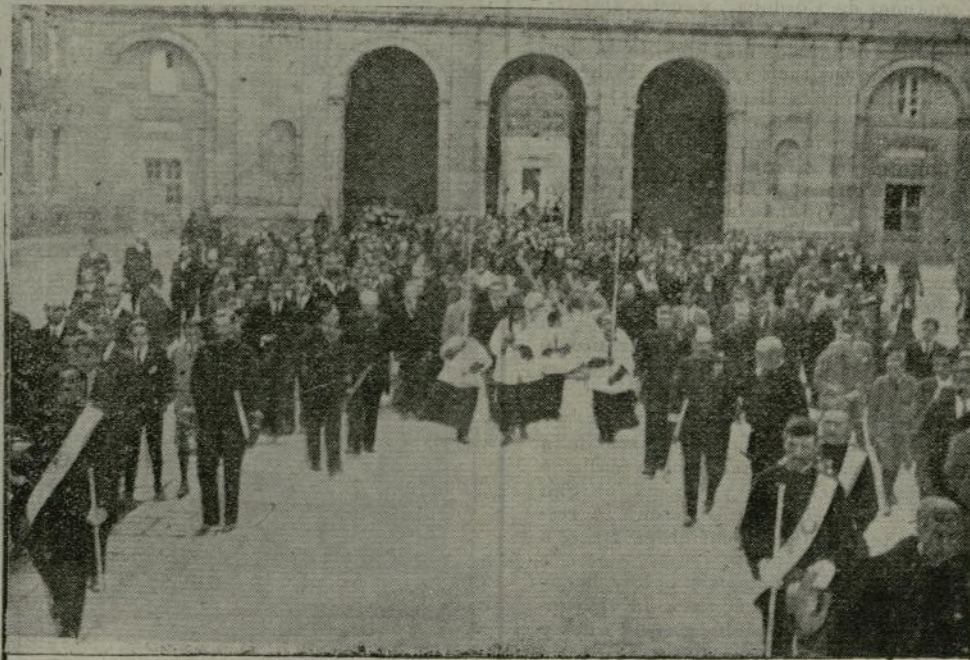
Llegada al Real Monasterio de El Escorial, del cadáver de S. A. la Infanta Pilar.

Apenas circuló la triste noticia llenóse de firmas el álbum.