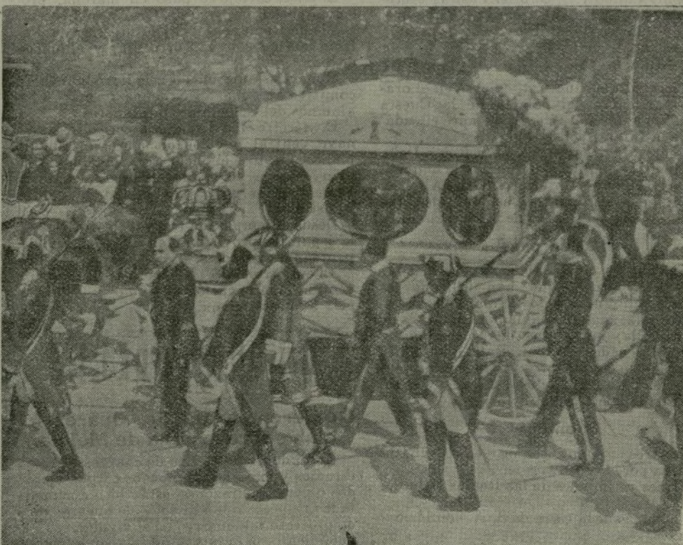
Paso de la fúnebre comitiva por la calle de Bailén, al dirigirse a la estación del Norte.